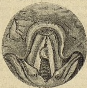
FIG. 2. a

Diagnosticado también de pólipo de naturaleza benigna por dos especialistas de la corte, vino á mi consulta en Noviembre de 1911 á oír mi opinión, y en efecto, pude comprobar la existencia de un fibroma de la cuerda vocal izquierda , inserto en la unión de los dos tercios anteriores con su porción central (véase fig. 2. a ),