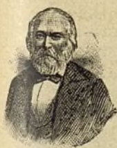
BROWN-SEQUARD. Antiguo Profesor de Medicina en el Colegio de Francia. Miembro del Instituto.

DA SALUD Á LOS ENFERMOS; FUERZA Á LOS DÉBILES; VIRILIDAD Á LOS IMPOTENTES; JUVENTUD Á LOS ANCIANOS.