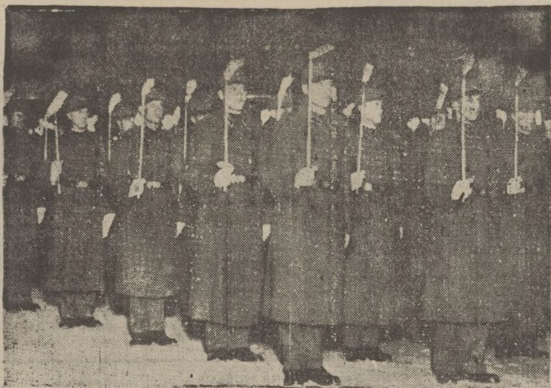
La restauración en Austria del servicio militar obligatorio se solemniza con una gran retreta con antorchas, que la foto reproduce, al pasar frente a la Cancillería.