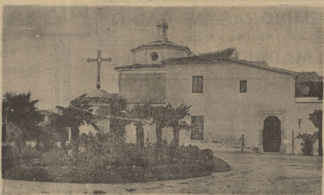
El Monasterio de Santa Maria de la Rábida, orgullo legítimo de las gestas hispanas

En las inmediaciones de la Rábida subsisten aún los restos