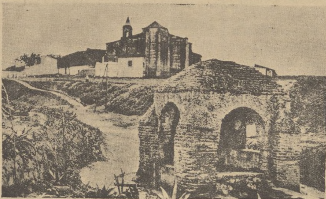
La Fontanilla de Palos de la Frontera, al fondo el templo parroquial de San Jorge

Ya dentro del sagrado recinto, bien pronto nos damos cuenta de que nos encontramos en un templo que tiene todas las características de una catedral en miniatura. Consta de cinco naves de gran extensión, siendo sus muros muy elevados. El altar mayor tiene forma de tem-