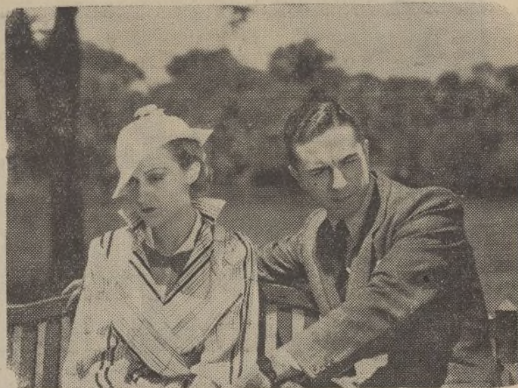
Una escena de la producción argentina de Cifesa, «El Caballo del Pueblo»

Al conocerse esta nota oficiosa del Gobierno, han circulado insistentes rumores según los cuales el Consejo de Ministros se ha reunido para hacer frente a la situación interior que se considera de gran gravedad.