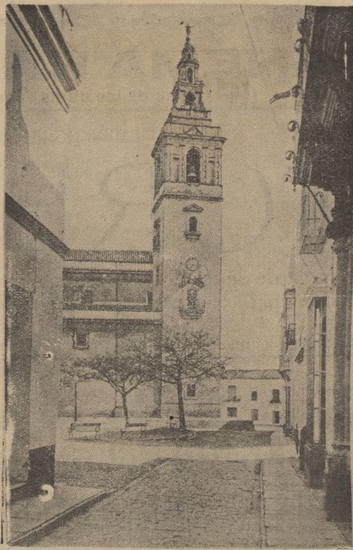
La torre de la parroquia de Moguer. «Era de cerca como una Giralda vista de lejos».

Al lado de la Epístola y también bajo arco, se encuentra otro sepulcro ojalá y estatuas de mármol de la Escuela italia-