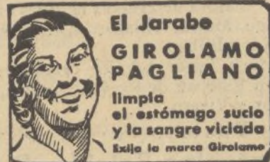
El Jarabe GIROLAMO PAGLIANO limpia el estómago sucio y la sangre viciada Exija la marca Girolamo