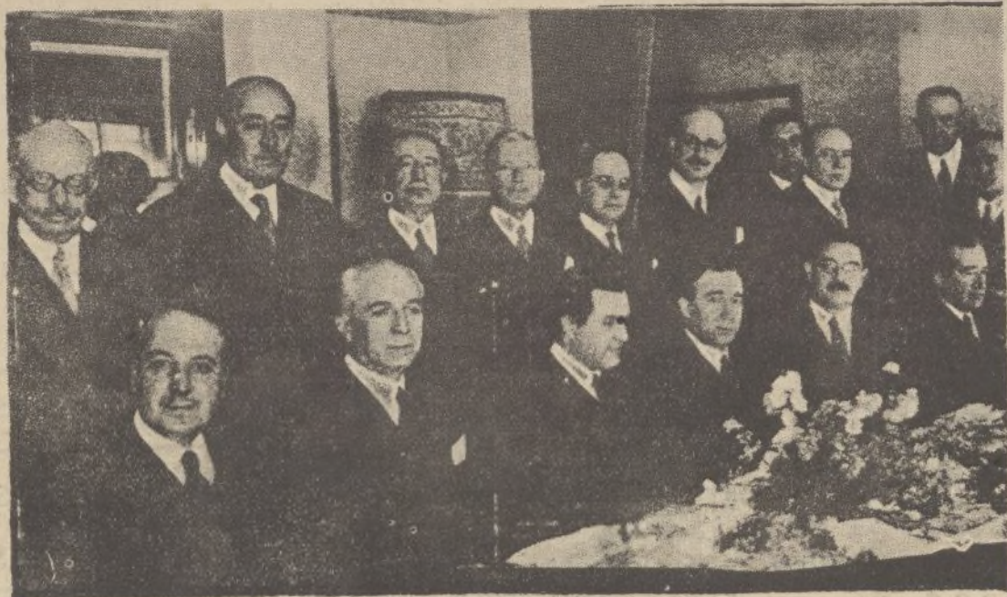
Grupo de concurrentes al banquete con que el Consejo Superior Bancario obsequió a los ministros de Hacienda y Fomento de Madrid