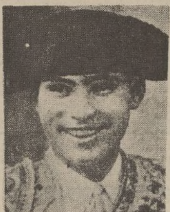
El famoso matador Domingo Ortega, que también pondrá cátedra de gran torero en la corrida de hoy.

Empezó la temporada el 8 de marzo en Barcelona y esa media docena de funciones celebradas desde tal fecha hasta el pasado domingo, se distribuyeron en capitales, toros y toreros, de la siguiente forma: