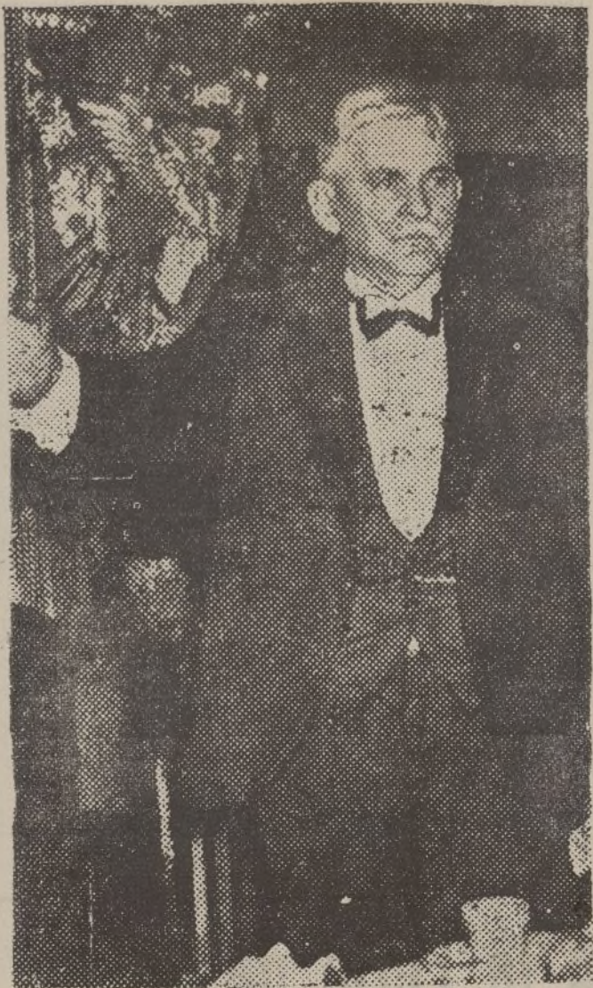
He aquí la figura del célebre doctor Condom, que fué el intermediario del coronel Lindberg y los kidnappers, y a quien Haupthman, días antes de ser ejecutado, hizo determinadas acusaciones.