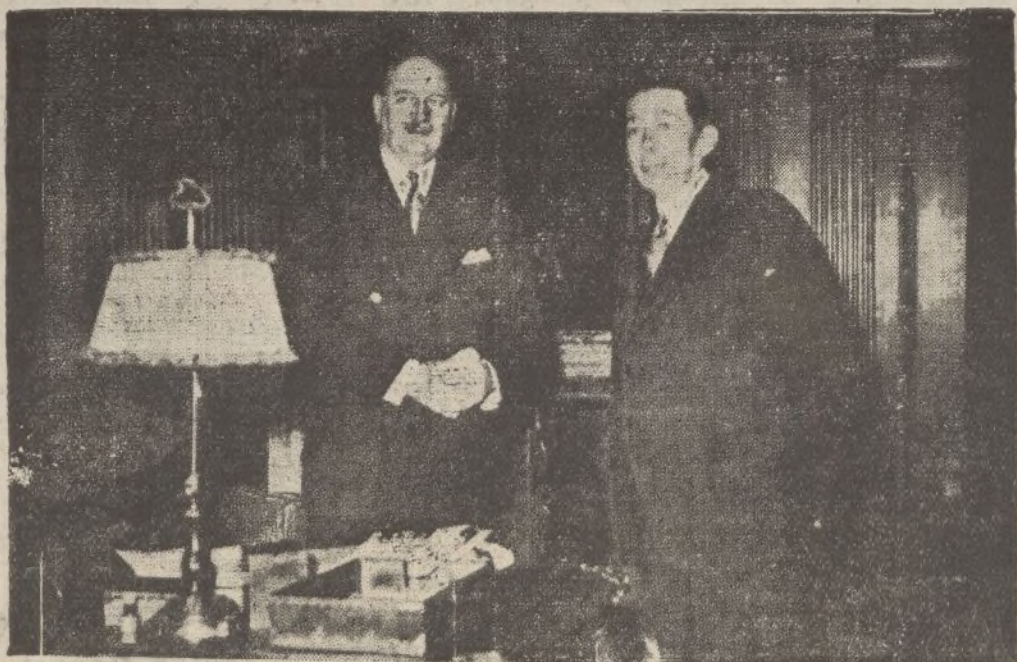
Los señores Titulesco—ministro de Negocios Extranjeros de Rumanía—y Flandin mantienen una detenida conversación en el Ministerio de Negocios Extranjeros de París.