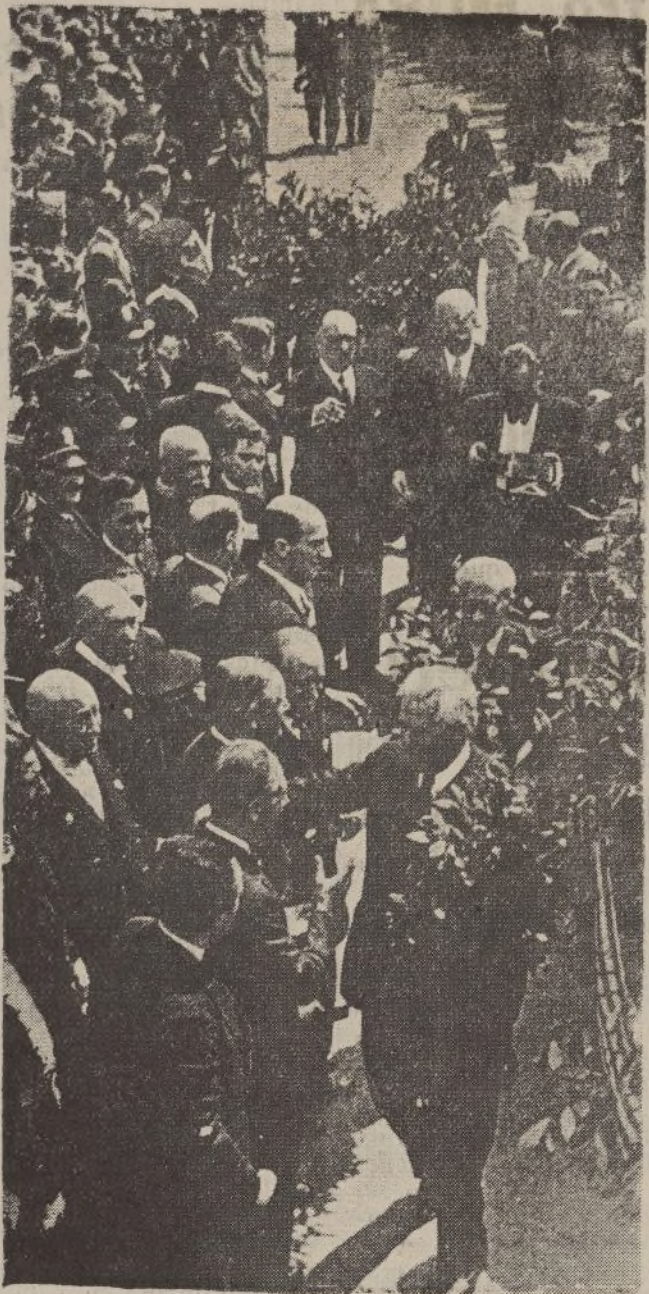
El Consejo de la Generalidad recibiendo, al pie del monumento de Pi y Margall, a las numerosas Comisiones llegadas de todos los pueblos de Cataluña para asistir al acto inaugural.