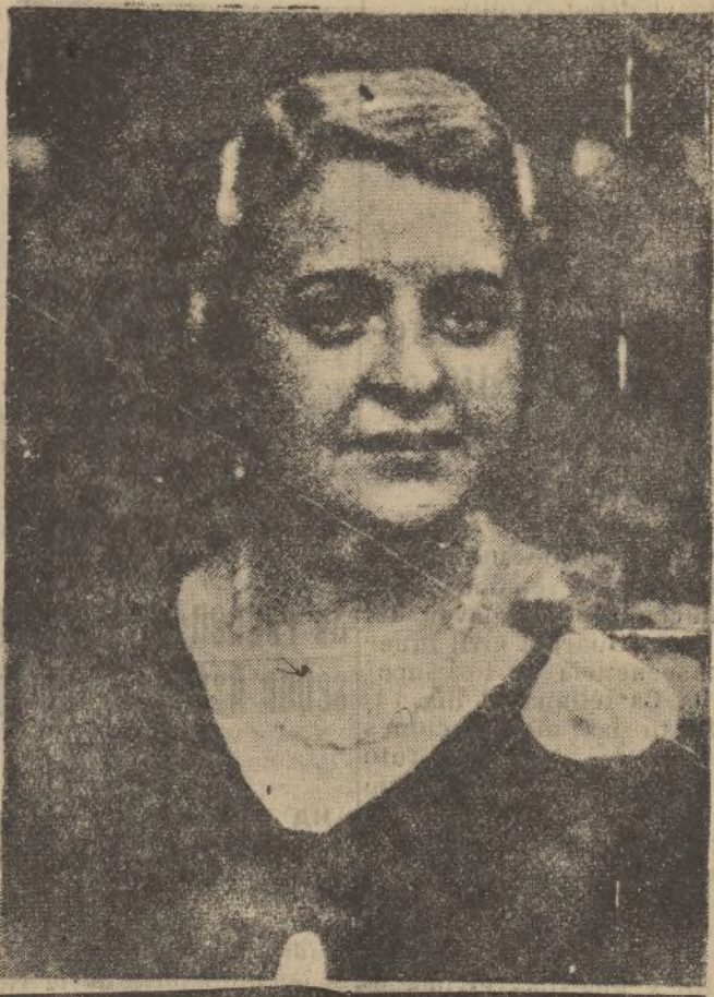
La recitadora española Greta Bravo, que ha resultado muerta en un accidente de automóvil ocurrido en Méjico. También resultaron heridos de gravedad tres amigos que la acompañaban