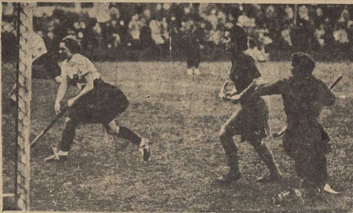
El equipo alemán—favorito del torneo—ha vencido al español en partido de campeonato de Europa de «hockey» femenino. Uno de los tantos alemanes.

que estamos muy satisfechos, y procuraremos en unos rápidos comentarios, demostrar al aficionado las causas de esto, que para muchos no tiene explicación.