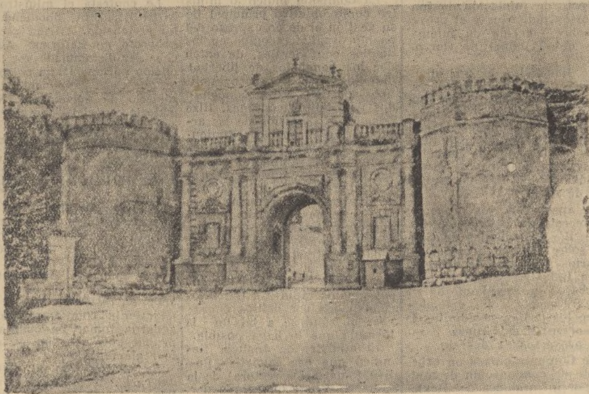
CARMONA.—Puerta de Córdoba

Tenemos confianza en el porvenir, y no creemos que esté muy lejana la fecha en que todas las deficiencias turísticas enumeradas, sean subsanadas en bien de Huelva.