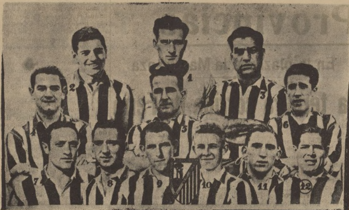
El Athletic Club madrileño, que al perder el domingo, frente al Sevilla F. C., pasa automáticamente a la Segunda División