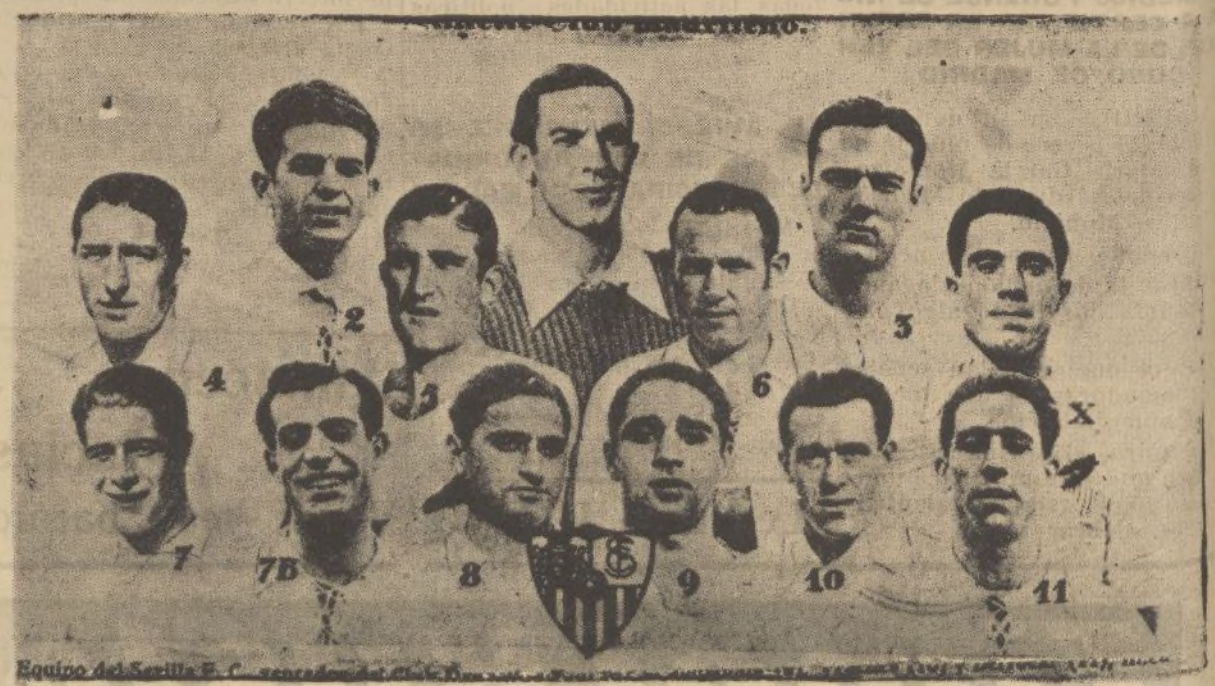
El Sevilla F. C. que en reñida lucha contra el Athletic madrileño ha conseguido al vencer a éste por tres goals a dos, mantenerse en la Primera División