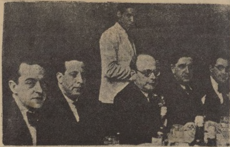
Las autoridades granadinas con el director del diario «El Defensor de Granada», en la presidencia del entusiástico homenaje que se tributó al citado popular diario.