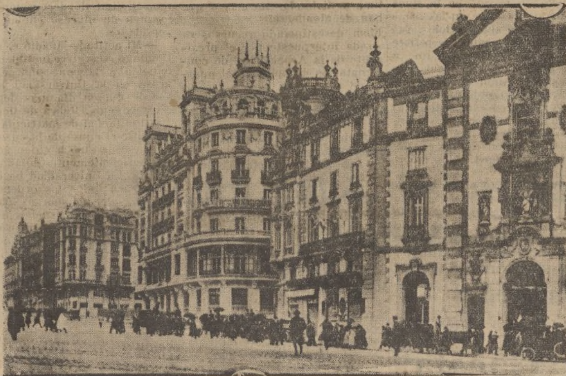
Entrada de la Avenida de Peñalver, que arranca de la iglesia de San José, en el trozo más ancho de la calle de Alcalá. Comienzo de la Gran Vía, que todavía está sin concluir en su último trozo. Inicio de las grandes reformas urbanas de Madrid y remedo prudente del rascacielismo neoyorquino.

en discusiones interminables... pero, «otra me quedará dentro», se lo aseguro.