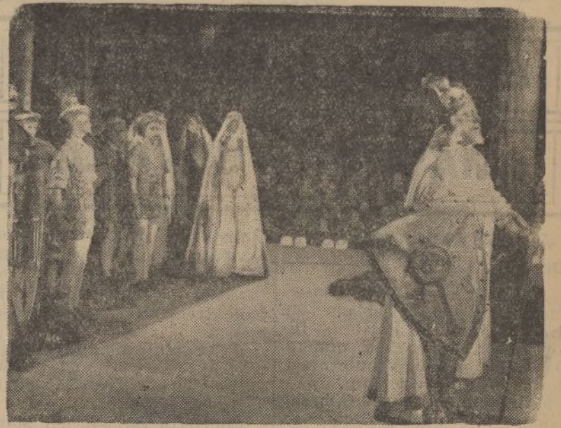
Benjamino Gigli, en uno de los momentos de mayor lucimiento de la producción inglesa «No me olvides», que presenta Cifesa.