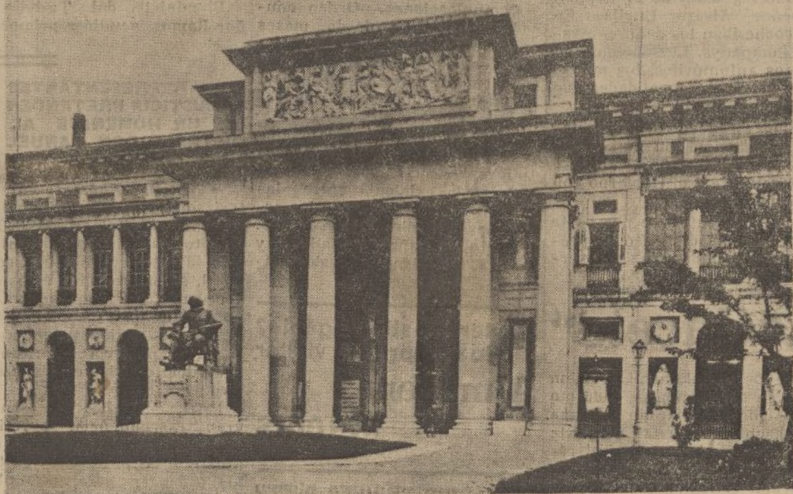
Una de las fachadas del Museo del Prado, a cuyo frente aparece el monumento a Velázquez, del cual se conservan en el interior de la gran Pinacoteca española, junto con otras grandes obras de los maestros de la pintura universal, sus mejores obras, orgullo de nuestra patria y deleite del mundo.

nuevas construcciones y las reparaciones de edificios, viejos unos, ruinosos otros, y muchos —demasiados— completamente ajenos a los principios más rudimentarios de la higiene, se vienen realizando en proporciones mayores a las que estábamos acostumbrados, el beneficio inmediato habrá sido para aquella modesta clase que, llamándose trabajadora, paradójicamente y contra todos los postulados de la razón y de la justicia, veía pasar los días, los meses, e incluso los años, con los brazos cruzados y sin poder ganar un jornal, condenada, por fuerza de su adverso destino, a la inanición.