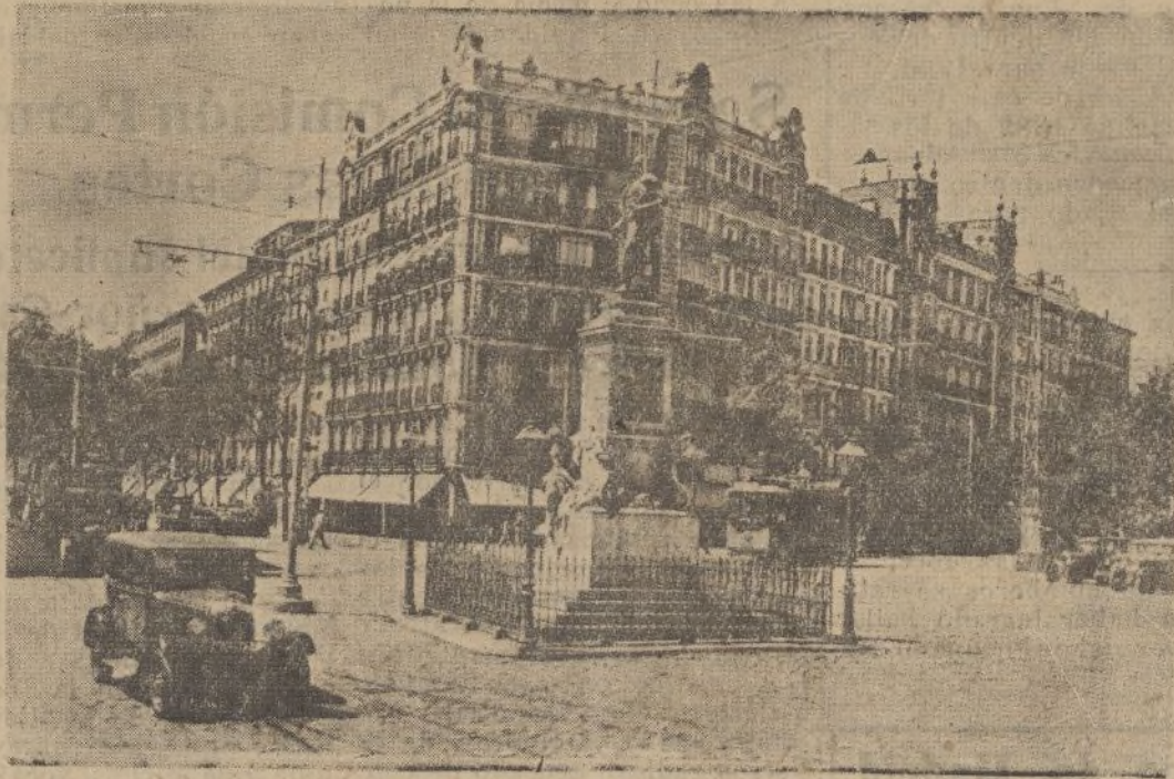
La popularísima y chamerrilera glorieta de Bilbao, en la confluencia de las calles de Carranza y Fuencarral, por su movimiento, animación y alegría es una sucursal de la Puerta del Sol, con la estatua en el centro del gran patricio Bravo Murillo, que llevó a Madrid el don inapreciable del agua del Lozoya.