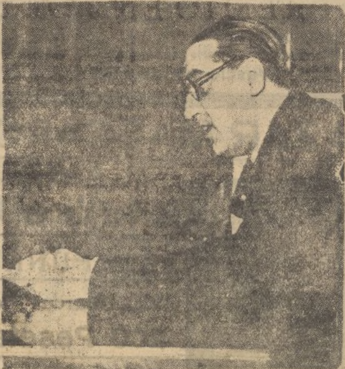
En Madrid, don Gregorio Marañón ha pronunciado una conferencia en el Museo Naval, de cuyo Patronato es presidente, versando sobre el tema «La Medicina en Lepanto»