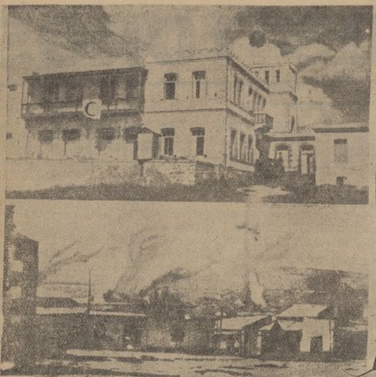
ABISINIA.—Dos interesantes fotografías del bombardeo de Harrar.—Arriba: El palacio del Negus envuelto en humo y llamas por la explosión de las bombas que sobre él arroja la aviación italiana.—Abajo: Una vista parcial de la ciudad, con sus edificios ardiendo o derrumbados por efecto del bombardeo.