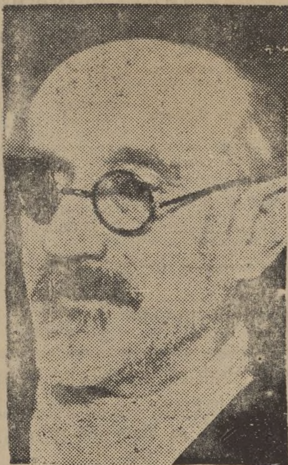
Don Ricardo Baroja, a quien ha sido concedido el premio «Día de Cervantes», otorgado a la mejor novela de 1935.