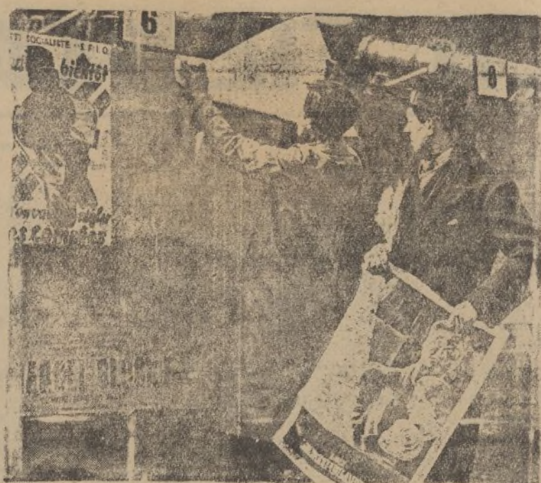
Ante las elecciones a diputados, convocadas en Francia para el próximo domingo 26, las calles de París se llenan de carteles.