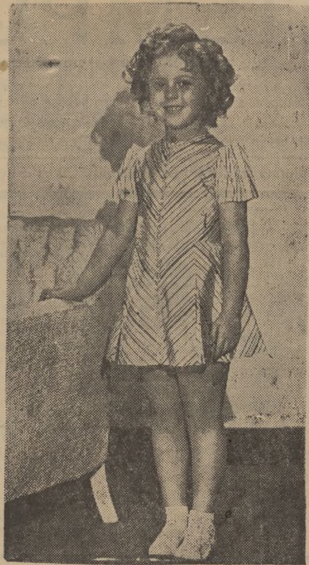
Shirley Temple, la precoz y popular «estrella» del cinema, en su producción, «La simpática huérfana», de la 20 Th. Century-Fox.