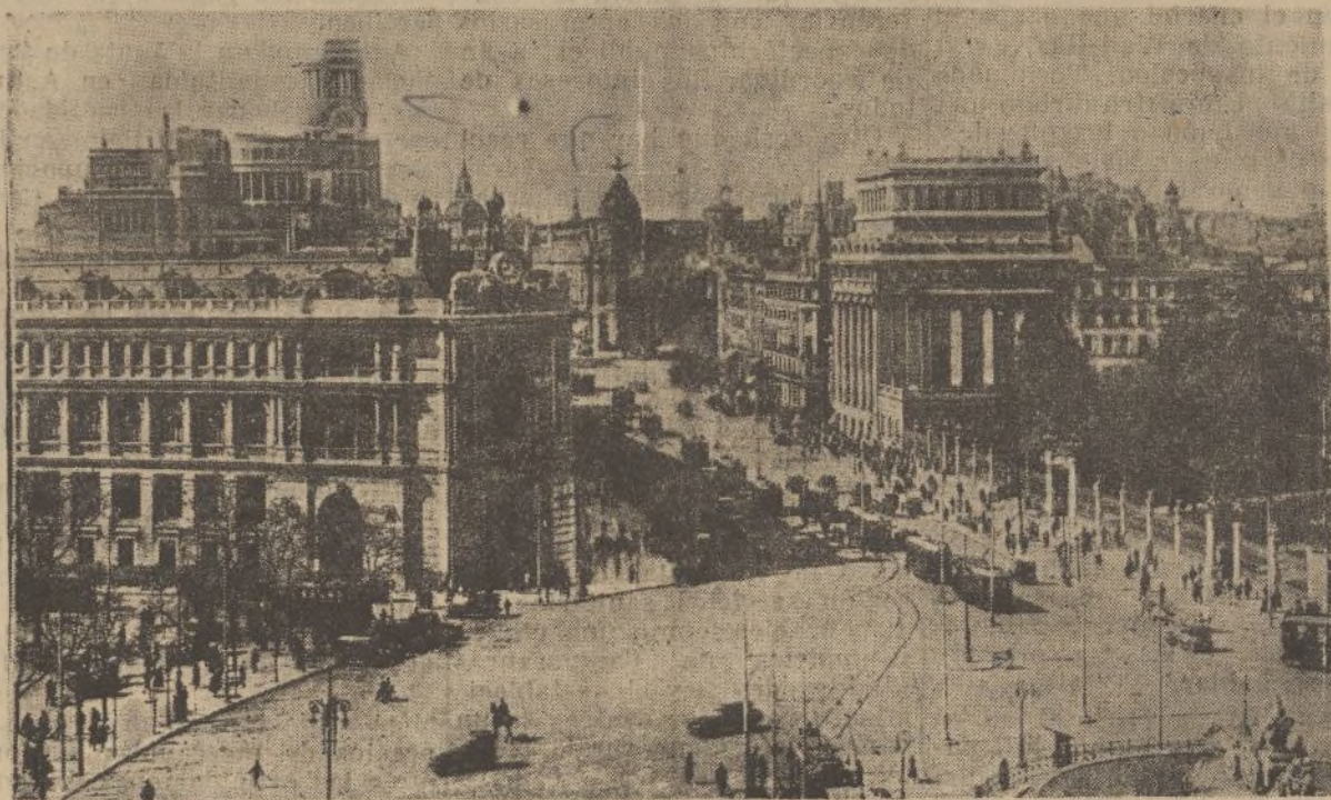
Grandiosa perspectiva de la calle de Alcalá vista desde la Cibeles. En primer término el Banco de España y el Banco del Río de la Plata, y, emergiendo su mole geométrica, el palacio del Círculo de Bellas Artes. En el centro de la magnífica rampa que asciende hasta la Puerta del Sol la fila india de los tranvías.

más. Un cirujano, por ejemplo, para serlo plenamente, debe poseer un bagaje científico extenso y en grado suficiente para poder darse a sí mismo cuenta de sus actos. No debe ser un simple malabarista que se limite a ejecutar técnicas manuales; debe ser, además, creador, con iniciativas de posible aplicación práctica. Y para esto necesita un control, que le permita aplicar sobre el enfermo, sin peligro, sus creaciones. Pues bien; sin un laboratorio experimental, no puede aspirarse a este ideal.