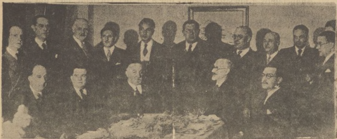
Una comida íntima celebrada en honor del gran escritor don Ricardo Baroja con motivo de haberle sido otorgado el preciado galardón del Premio Príncipe de Madrid.