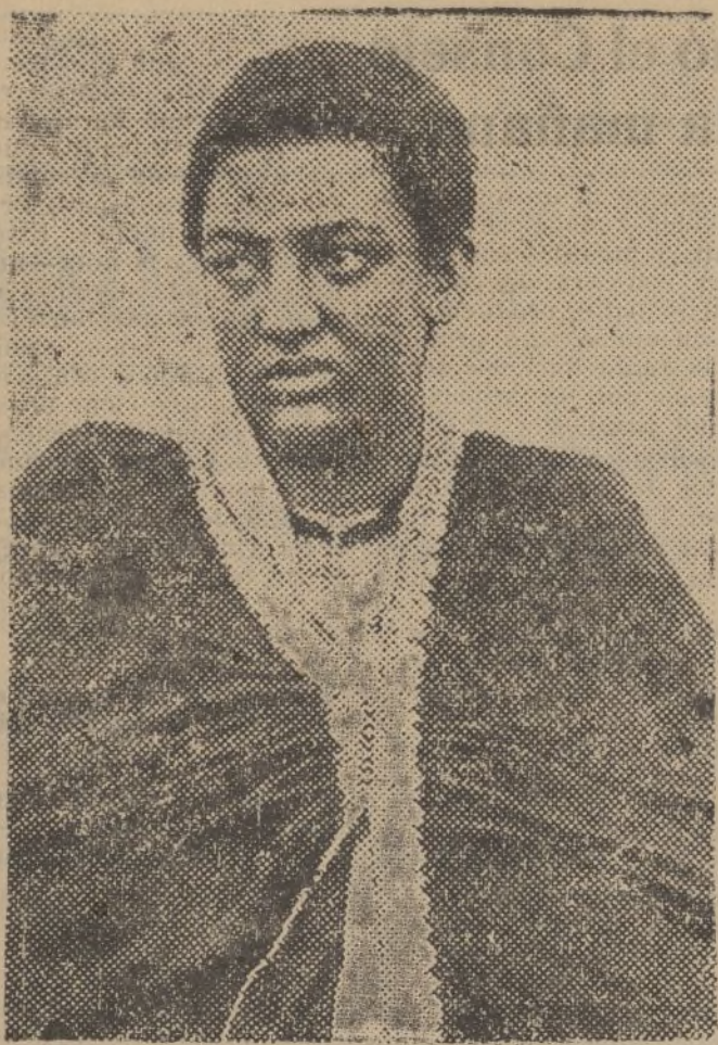
Esta fotografía representa a la esposa del emperador de Abisinia que en unión de su marido ha huido de Addis Abeba.