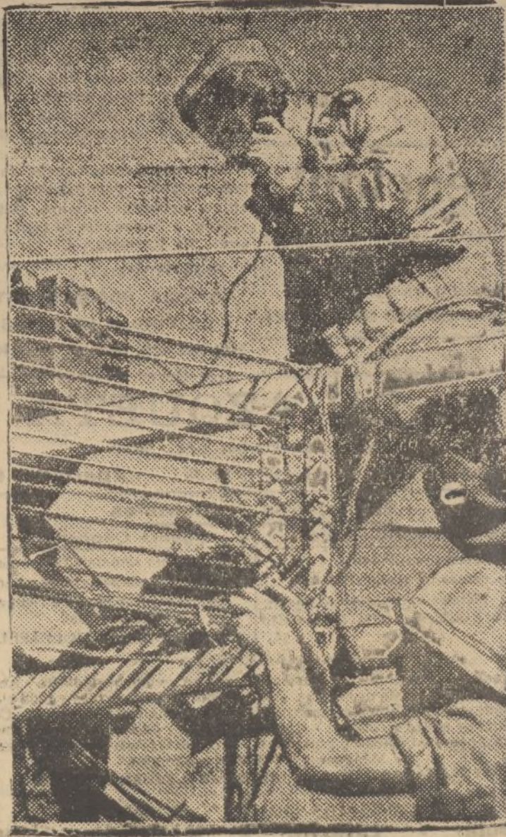
La foto representa a dos técnicos italianos trabajando en la colocación de hilos telefónicos en el frente Norte