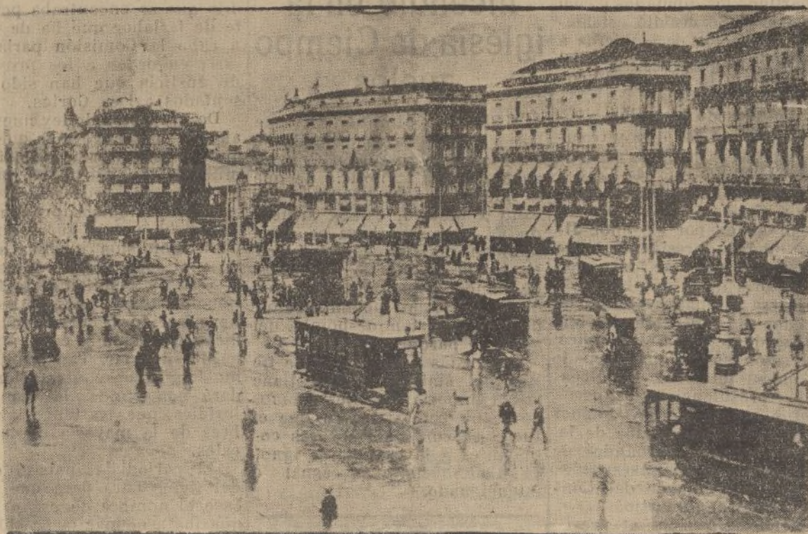
La Puerta del Sol, ágora del pueblo madrileño y meta de todos los acontecimientos políticos, manifestaciones populares y perturbaciones de orden público. Ombligo de España y centro vital de la actividad madrileña, donde aún quedan algunos cafés castizo y sigue bajando, a las doce del día, la bola de Gobernación...