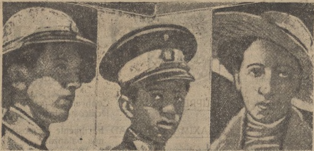
Los hijos de la familia real en Abisinia: el príncipe heredero, Asfou Wosan; el príncipe Makonnen y la princesa Isshai, hijos del matrimonio.