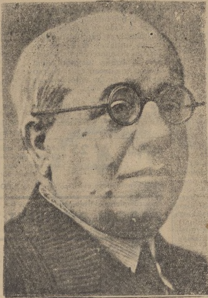
Su Excelencia el nuevo Presidente de la República D. Manuel Azaña Díaz