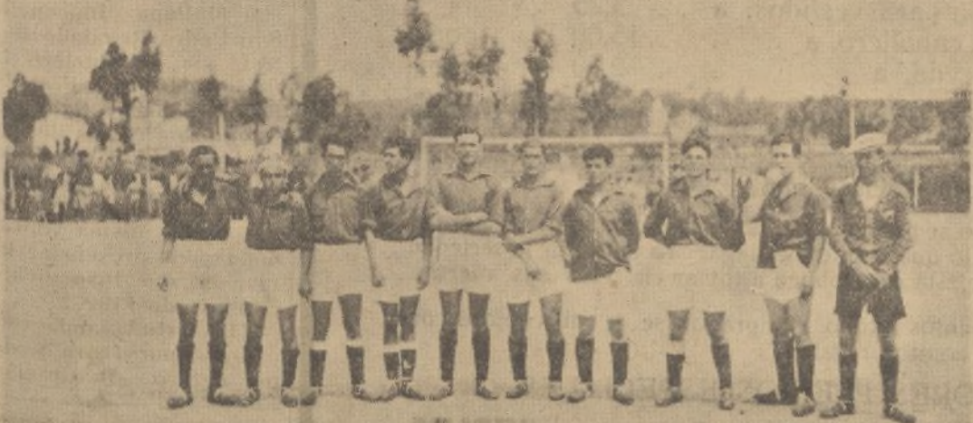
El Sport Obrero que el pasado domingo empató a dos goals con el Bloque F. C.