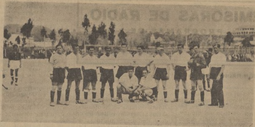
El Bloque F. C. que el pasado domingo jugó con el Sport Obrero