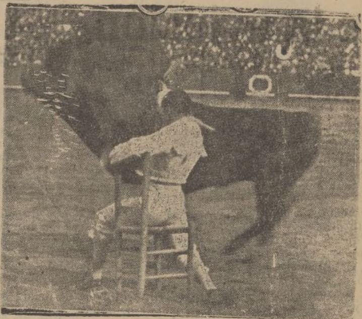
Pascual Márquez, el formidable torero, da un gran pase, sentado en una silla. ¡Estampa antigua!