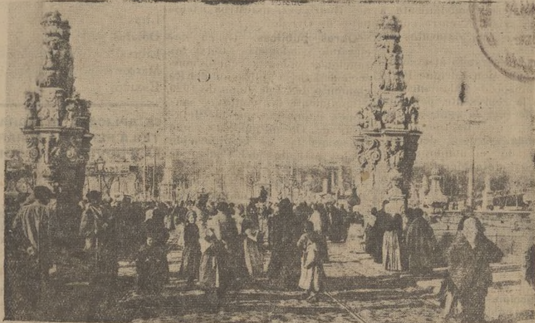
Puente de Toledo, notable construcción de piedra acabada en 1732, con templete de gran estilo barroco a la entrada y en el centro, con las estatuas de San Isidro y Santa María de la Cabeza. Punto de paso populoso hacia la castiza pradera de San Isidro, romería famosa desde los tiempos de Goya... ...si calentura trujeres volverás sin calentura.