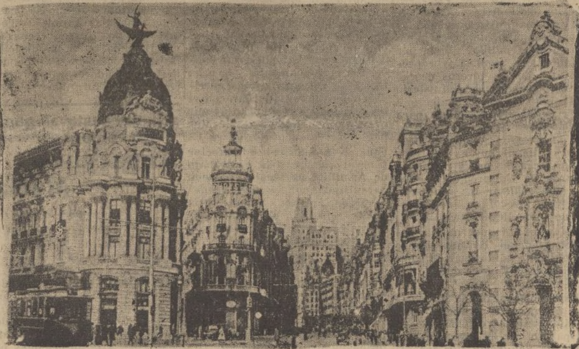
Soberbio arranque de la Avenida del Conde de Peñalver, iniciador, siendo alcalde de Madrid, de esta suntuosa Gran Vía, que es ornato y orgullo de la capital de la República.