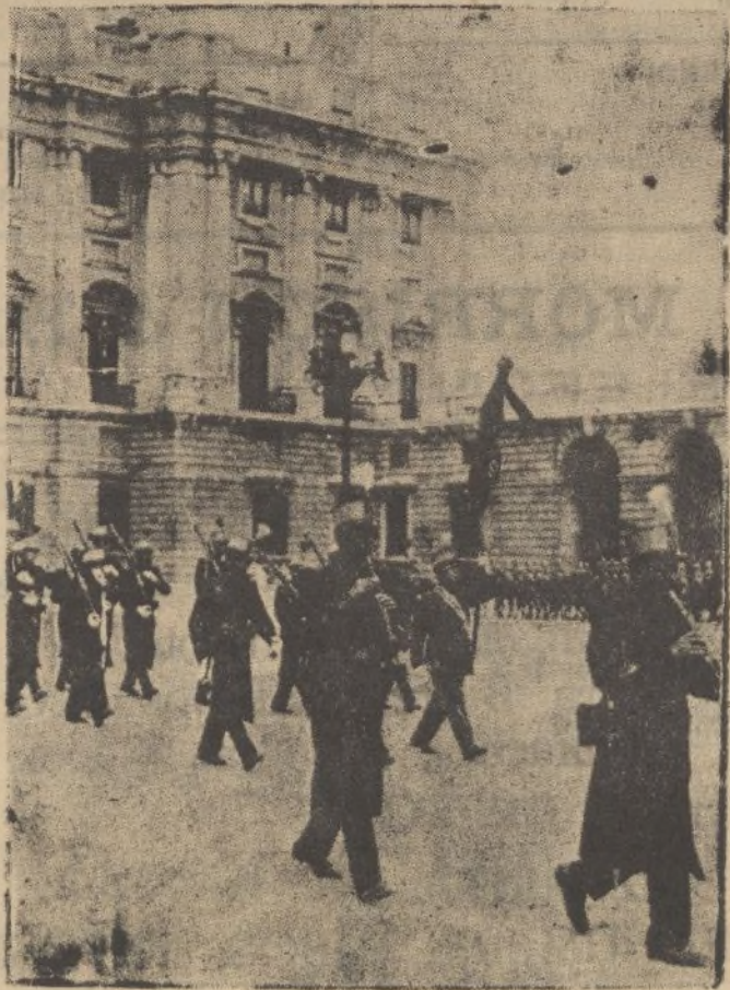
Un momento de la parada de la guardia de Palacio, que ha vuelto a efectuarse, y que hacia seis años que no se realizaba.

Rayos X, diatermia médica y quirúrgica, rayos ultravioleta, en sus aplicaciones bucales Vázquez López, 23. Teléfono, 1779 HUELVA