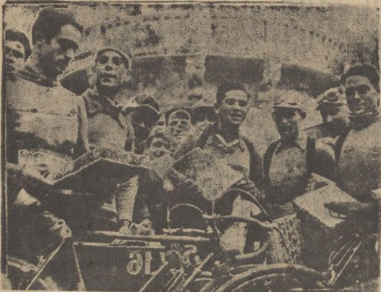
Los corredores, que fueron muy agasajados en Granada, recibieron presentes como recuerdo de su paso por la bella capital andaluza