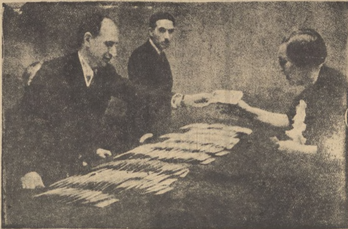
Los compromisarios, cumplida la misión para que fueron elegidos, pasan a percibir su asignación en el departamento habilitado al efecto en una dependencia del Retiro. Este funcionario va entregando a los asambleístas, en este caso femenino, la consignación correspondiente.

—Cañardo es de esperar que marche mejor que ahora, no ya ayudado por la suerte, que él tiene méritos propios, sino sim-