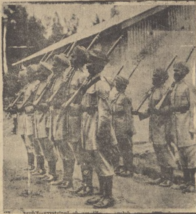
Las fuerzas de Sikhs, que defendieron la Legación de Inglaterra en Addis Abeba