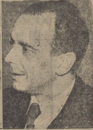
Don Juan Moles, de Izquierda Republicana, ministro de la Gobernación; don Bernardo Giner de los Ríos, de Un.ón Republicana, ministro de Comunicaciones; don Antonio Velaz, de Izquierda Republicana, ministro de Obras Públicas, y D. Juan Lluhi, de Esquerra Catalana, ministro de Trabajo.