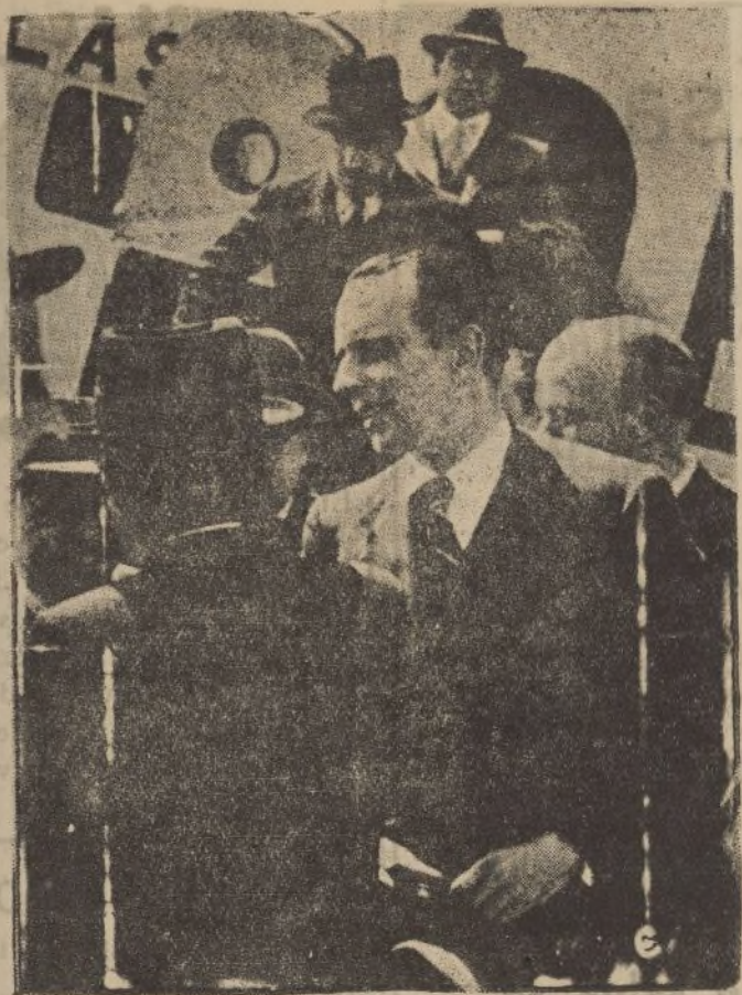
El ministro de Trabajo, señor Lluhí, al llegar en avión al aeropuerto de Barajas, procedente de Barcelona.