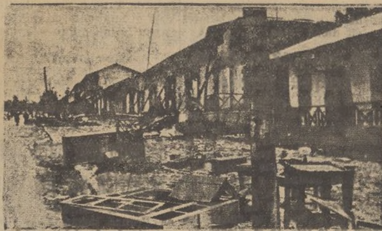
A la izquierda: Este desolado aspecto ofrecía una de las principales calles de la capital etíope momentos antes de que las fuerzas del mariscal Badoglio se apoderasen de Addis Abeba. A la derecha: Al entrar las tropas italianas en la capital abisinia, el espectáculo era desolador. Casi toda la ciudad era un enorme montón de humeantes ruinas, y las casas de calles enteras habían sido derrumbadas. Los bandidos saquearon los almacenes, cuyos propietarios huyeron al campo.

Nota.—Admitido el derecho personal; se cierra el plazo del billete el 22 a las 8 ocho de la noche. Referencias y detalles, «Las Canarias», San José número 31.