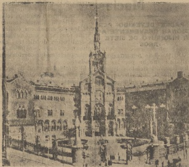
EL HOSPITAL DE SAN PABLO