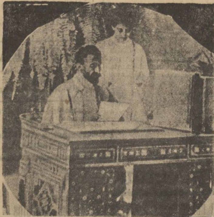
El emperador de Abisinia, Haile Selassie, ha mejorado en su quebrantada salud desde que reside en Jerusalén. Son sus propósitos trasladarse a Ginebra para tomar parte en la defensa de Etiopía ante la Sociedad de Naciones.