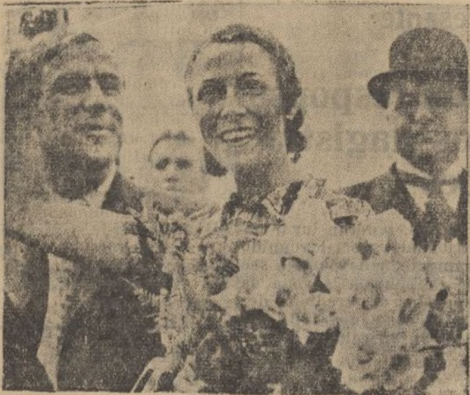
GROIDON.—La célebre aviadora Anny Mollison, después de batir el «record» de la travesía El Cabo- Londres, llega al aeródromo de Croydon, donde es agasajada por las autoridades.