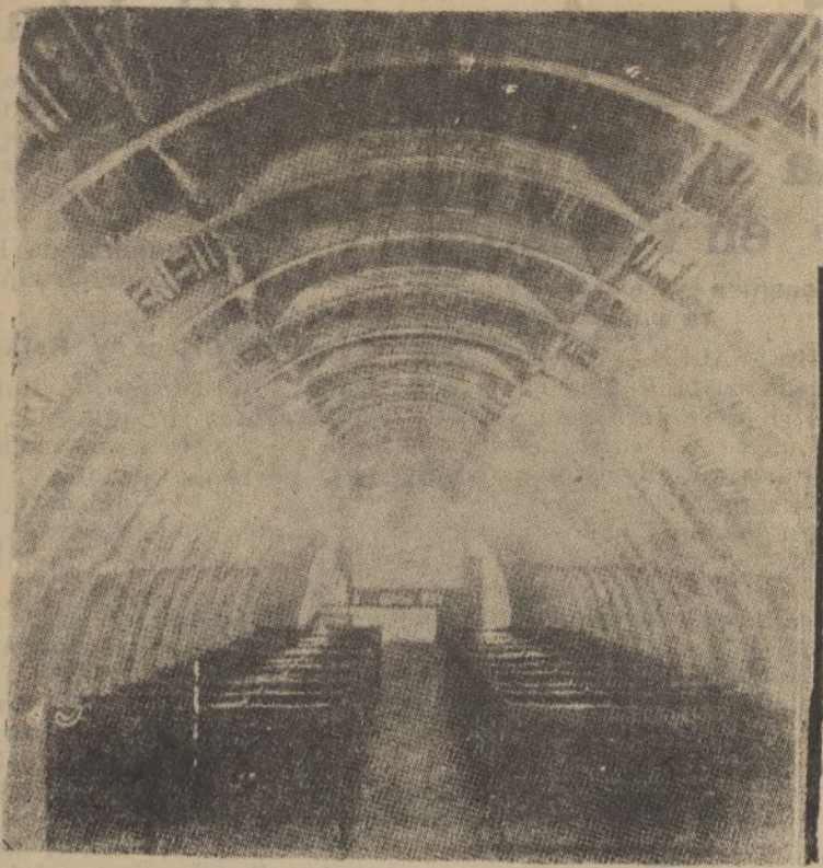
FRANCIA.—En la comarca renana se ha inaugurado este cine a 600 metros de profundidad, aprovechando una antigua galería subterránea.