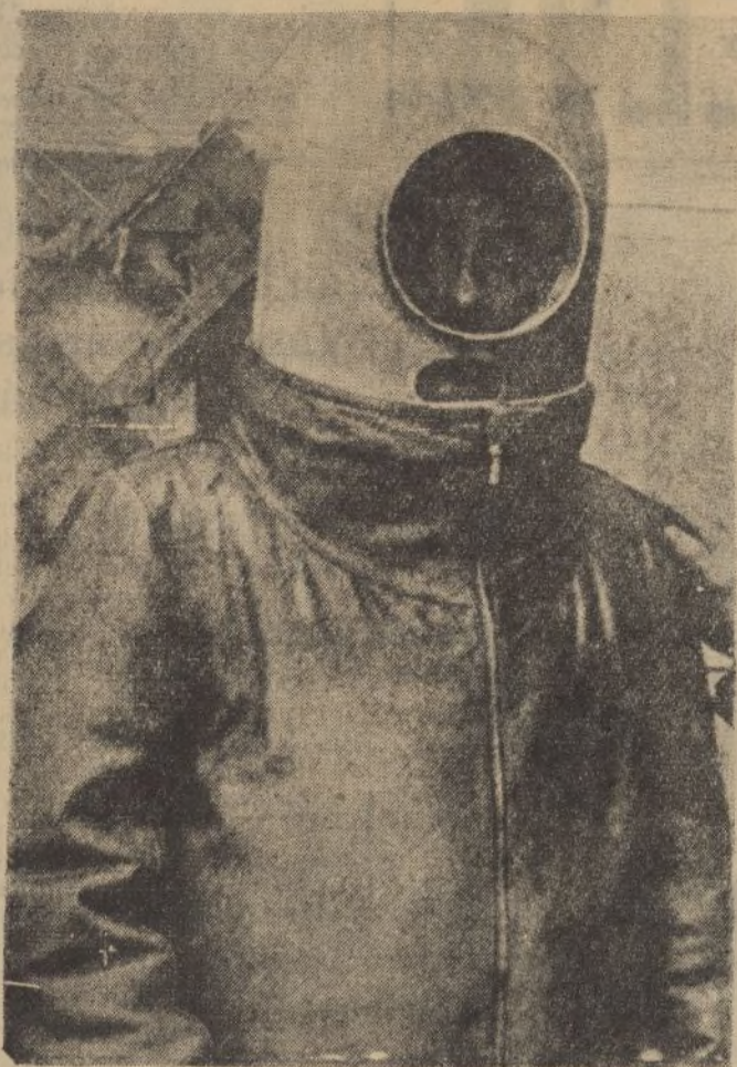
El ilustre aviador teniente coronel don Emilio Herrera, con el traje y escafandra que ha probado, con completo éxito, ante el Comité de Ascensión, en el aerodromo de Cuatro Vientos, y que utilizará en su vuelo estratosférico