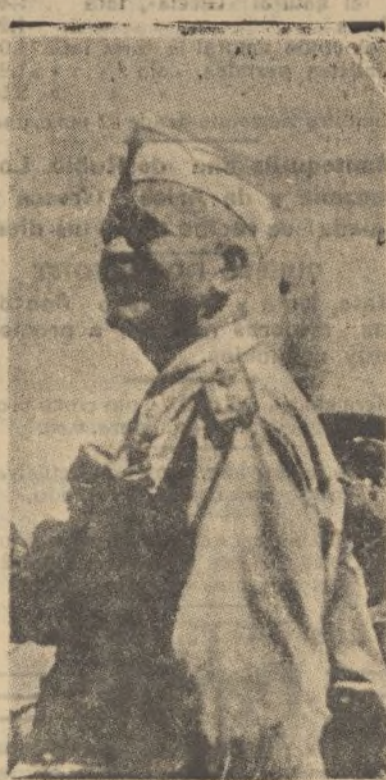
El mariscal Badoglio, jefe supremo de las tropas italianas y virrey de Abisinia. La foto está hecha el día de la entrada en Dessie

El juzgado practicó las diligencias de rigor, habiendo impresionado el suceso muy vivamente al vecindario.