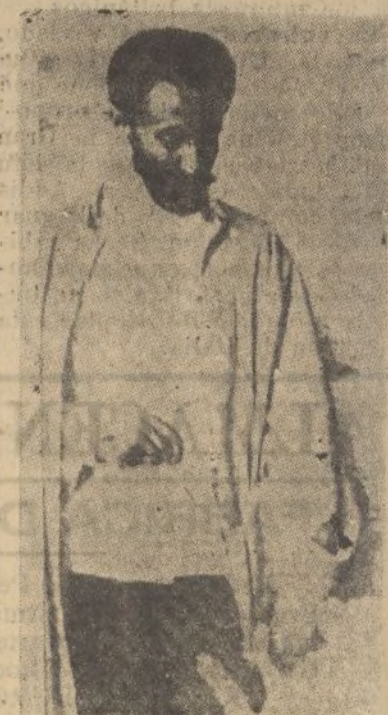
En el refugio de la derrota, el que fué, hasta la entrada de las tropas en Addis Abeba, emperador de Abisinia, se deja retratar junto a su residencia en Jerusalén—el hotel Rey David—jugando con «Lulio» su perro favorito