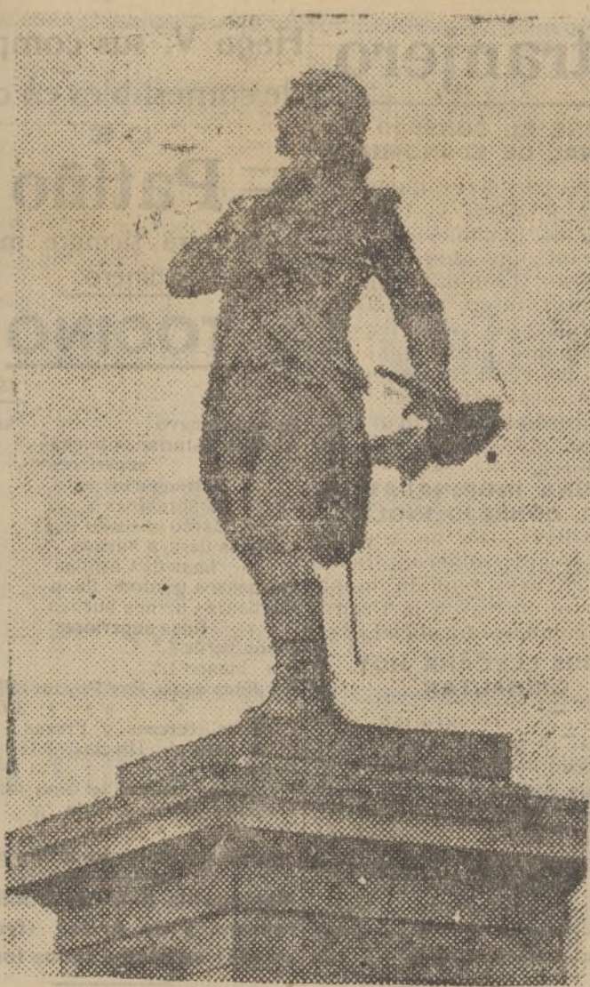
En Francia se prepara un homenaje a la memoria de Rouget de Lisle, con motivo de cumplirse el centenario de su muerte. Fué Lisle el autor de la música y letra del más famoso de los himnos nacionales, «La Marsellesa». La foto representa el monumento erigido al célebre compositor en Choisy le Roy.

Los precios de los abonos se anunciarán oportunamente.