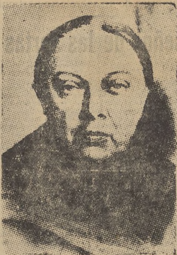
María Kripskaia, viuda de Lenin, de la que se dice que ha desaparecido de manera misteriosa