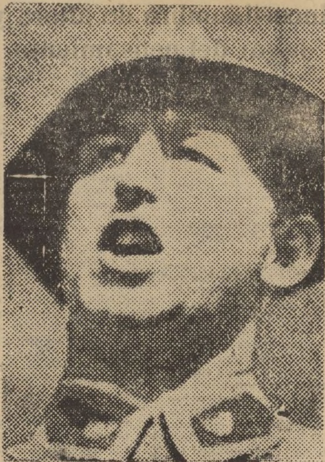
El príncipe Starhemberg, cuyas propiedades han sido objeto de una agresión frustrada