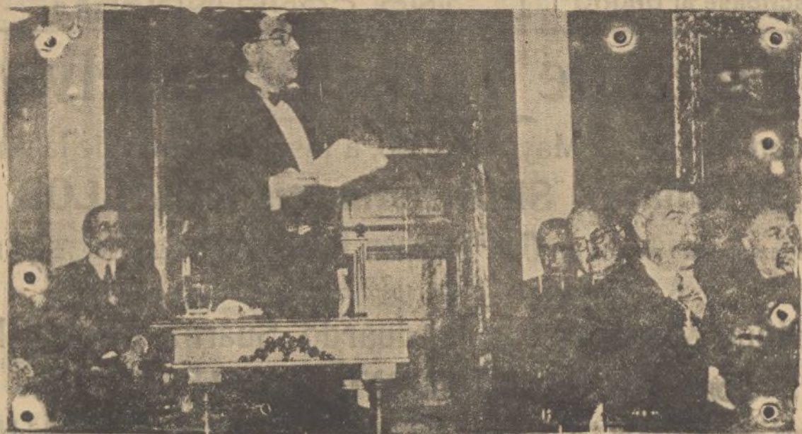
En la sesión celebrada el domingo por la Academia de la Historia tuvo lugar, ante numerosa y selecta concurrencia, el acto solemne de la toma de posesión, como miembro de la doctoración, de una de las figuras más eminentes de la ciencia y de la intelectualidad española, el profesor don Gregorio Marañón. El recipiendario, en un momento de su discurso