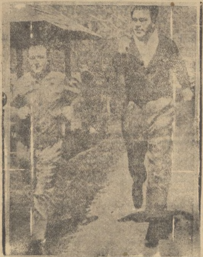
Schemeling se entrena a fondo en su campamento, sito a 150 kilómetros de Nueva York, para su trascendental «match» con Joe Louis, que se efectuará el próximo mes.

El campeón alemán haciendo «footing» con su entrenador