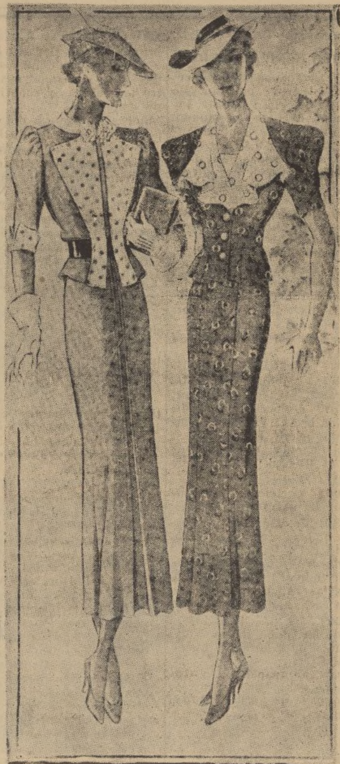
Originales conjuntos para primavera