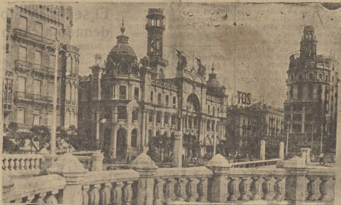
PLAZA DE EMILIO CASTELAR