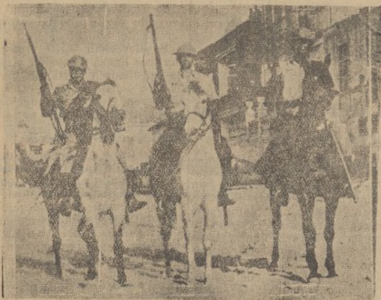
Fuerzas del Ejército británico, armadas de rifles, patrullan por las calles de Palestina para mantener el orden.