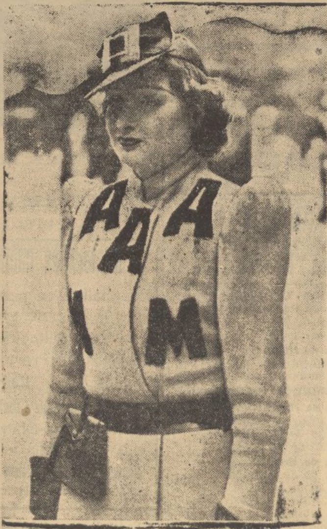
En Longchamp, pretexto para el desfile de modas primaverales, ha llamado la atención este sencillo atavío, tan original en sus detalles, como airoso en el conjunto.

Las tapicerías de colores, sean de lana o de seda, se frota con una franela o con un cepillo de terciopelo de lana, espolvoreado con albayalde o con creta en polvo, a fin de eliminar el humo y demás sustancias extrañas, que no se adhieran mucho; después se lava la tela con una decocción de palo de jabón y se deja sumergida diez minutos en agua saturada con ácido cítrico; se extiende luego, húmeda toda vía, sobre un telar, y se hace secar rápidamente. Cuando la tapicería esté casi seca, se puede planchar al revés, teniendo cuidado de ponerle debajo una tela humedecida con una disolución de alumbre; el cual aviva los colores.