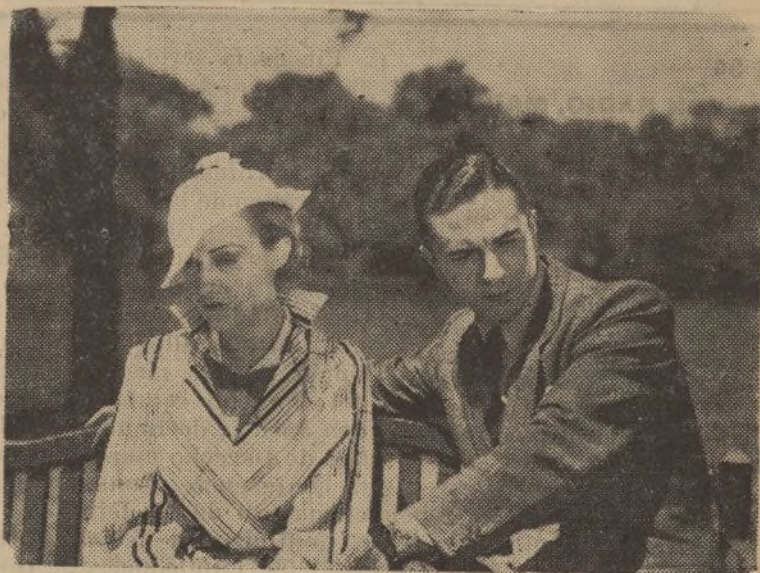
Un primer plano de «El caballo del pueblo», película argentina que presenta «Cifesa»