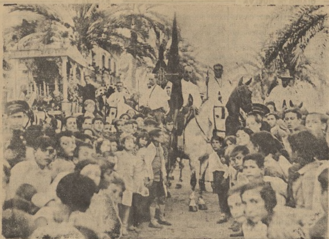
Todos los años, al ser colocado el estandarte de la Virgen del Rocío en su carroza de plata, el pueblo se congrega alrededor de la misma para exteriorizar sus simpatías y entusiasmos por la tradicional y clásica romería.