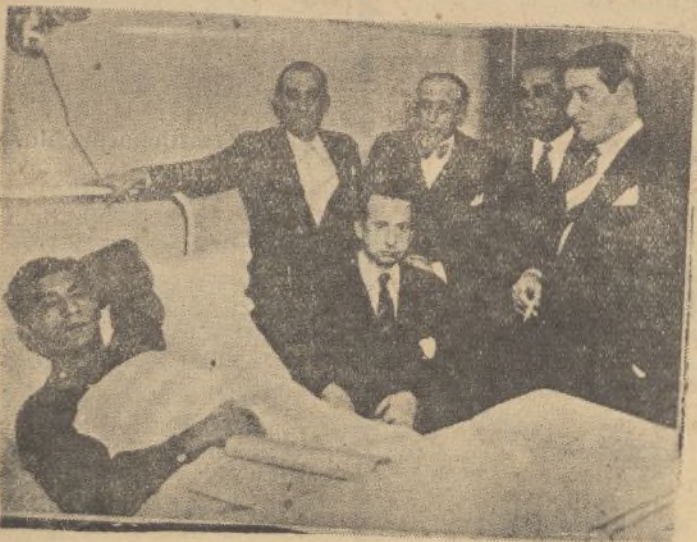
El famoso diestro Joaquín Rodríguez (Cagancho), gravemente herido por un toro en Barcelona, en la clínica donde se le asiste, con un grupo de amigos.

Seguidamente el cadáver fué depositado en una de las dependencias de la plaza, donde se instaló la capilla ardiente, muy visitada durante toda la noche y mañana del lunes por compañeros de la troupe Llapi-