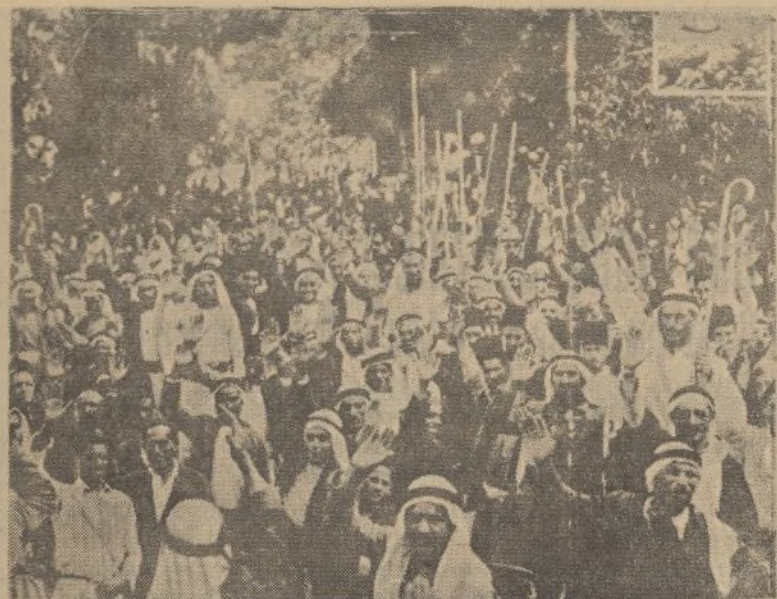
Grupos árabes, dirigiéndose a asistir a la Asamblea de campesinos, en la que se reunieron más de veinte mil, que acordaron proclamar el boicot contra los judíos y sus mercancías y la huelga general hasta que el Gobierno limite la inmigración judía a Palestina.