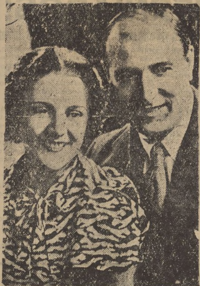
La bella y popular artista Imperio Argentina y el notable director Florian Rey, en cuyo honor se celebró una función en Madrid con motivo de la centésima representación de «Morena Clara».