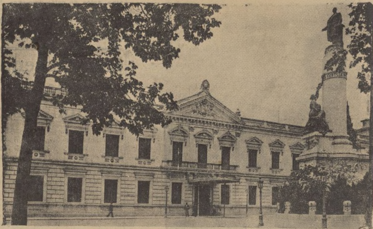
Palacio del Senado, hoy en completo desuso. Entre otros recuerdos históricos se cuenta el de la coronación en su recinto del gran poeta Quintana el año 1855. En la explanada-jardín que existe delante de este edificio, antigua residencia de doña María de Molina, se yergue el monumento erigido a Cánovas.