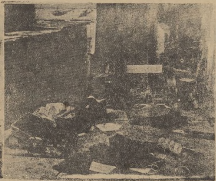
En una casa de cambio de la calle de la Cruz, penetraron ladrones, que se apoderaron del dinero contenido en la caja de caudales y en la máquina registradora. Un aspecto del local al descubrirse el robo