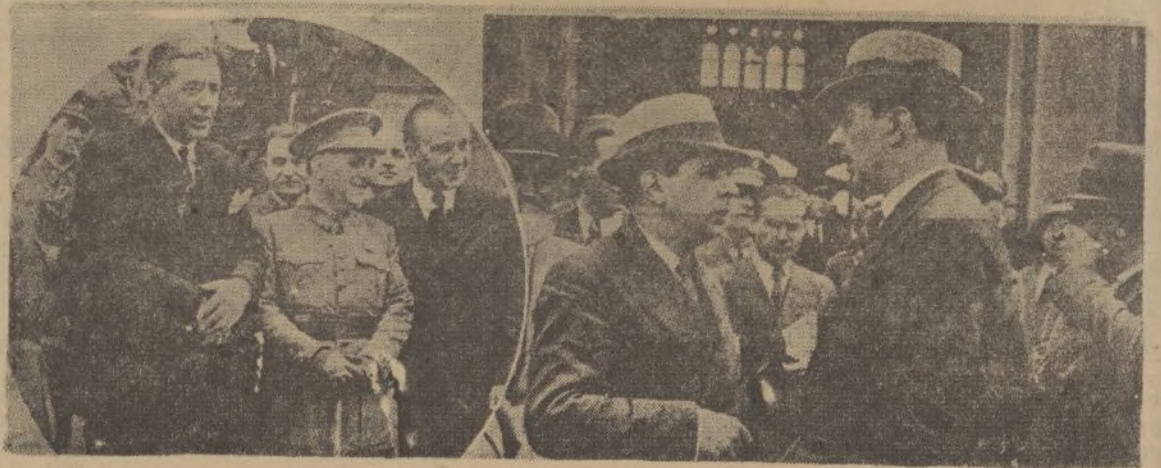
A la izquierda, el ministro de Industria y Comercio, señor Alvarez Buylla, momentos después de su llegada a la capital de Cataluña. A la derecha, el ministro de Trabajo, señor Lluhi, a su llegada a Barcelona, cambia impresiones acerca de los importantes temas que motivaron su viaje con el consejero de Trabajo de la Generalidad.