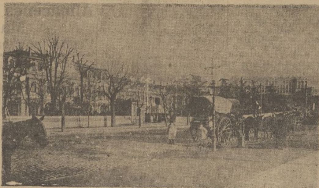
Estación del Norte, espléndidamente ampliada en 1934. El cuerpo central del nuevo edificio tiene un amplio vestíbulo, en el que se abren 11 taquillas para la adquisición de billetes.