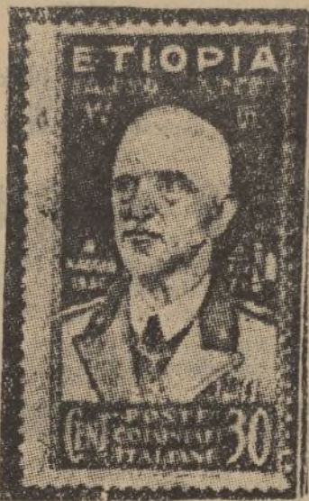
El nuevo sello de Etiopía con el retrato del rey de Italia y emperador de Abisinia

Dijo también el señor Valdés que se había oficiado al comandante del puesto de la Guardia civil de Punta Umbria para que se eviten las coacciones que se vienen cometiendo en dicho lugar contra las Salinas de Astur, pudiendo trabajar en las mismas cuantos obreros admitan libremente los dueños de aquellas.