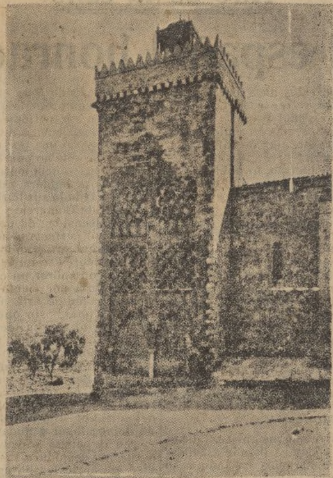
Aracena.-La llamada «torre mocha», alminar sublime del Castillo.

Penetramos en la iglesia. El coro, bien conservado, es del mismo estilo y época del templo, constando este de tres naves, ojivales también de piedra de granito con excelentes bóvedas.