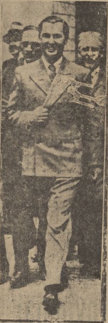
Monsieur Léon Degrelle, jefe del partido Rexista belga, que ha obtenido tan resonante éxito en las elecciones, sale de Palacio de visitar al monarca belga.