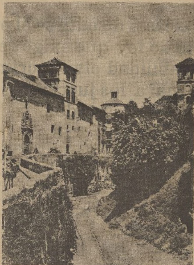
CARRERA DEL DARRO