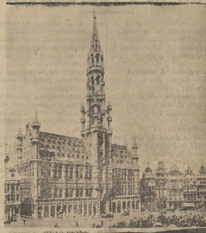
Ayuntamiento de Bruselas

64.000 pesetas para mitigar el hambre trágica del pueblo de Ayamonte, que atraviesa una situación muy difícil desde hace cinco o seis años. Pues bien; al pueblo de Ayamonte, que no puede esperar más tiempo, se le otorga una subvención para efectuar obras en el mismo casco de la población, y, a pesar de haber transcurrido dos meses, no han empezado todavía a realizarse. Por eso yo digo que no es justo que por los retrasos en los libramientos, por dificultades de la burocracia, por el sistema que sigue Hacienda, no se remedie tan aflictiva situación. Lo importante es que los pueblos pasan hambre y no reciben el dinero necesario. Esto debe terminarse o decirse claramente que no se les puede conceder cantidad alguna, ya que así no tendrán esperanza de que llegue a su poder. (Rumores en las tribunas de derecha.—La Presidencia reclama orden.) Sus señorías fueron los primeros en el escamoteo. (Varios señores DIPUTADOS: Damos la razón a S. S.).