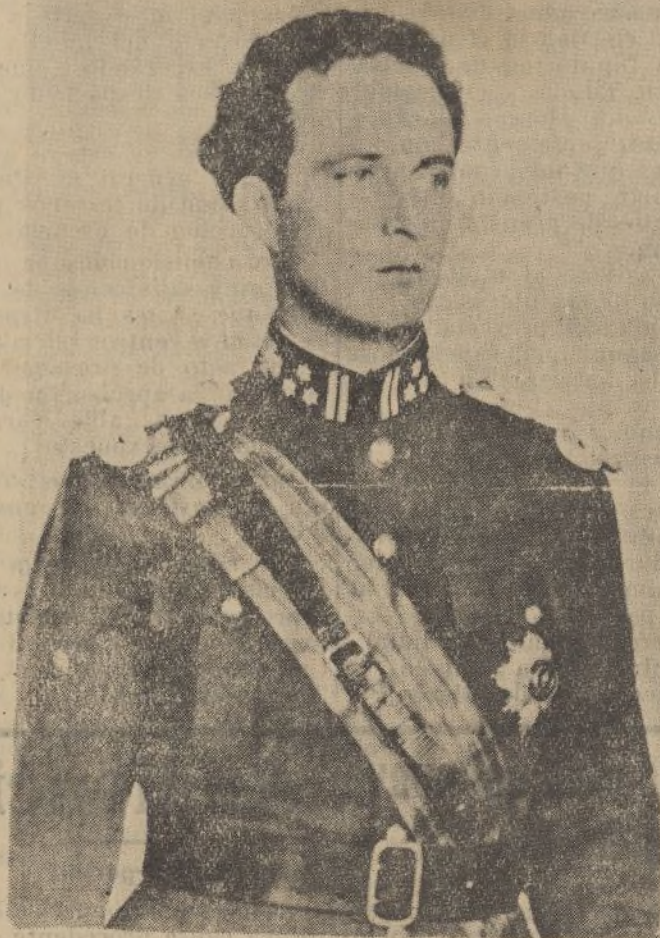
S. M. Leopoldo III, rey de los belgas, y a quien el resultado de las últimas elecciones legislativas le impone consultar a los primates políticos enemigos del régimen para la formación de un Gobierno acorde con la voluntad del pueblo belga expresada en las últimas elecciones generales.