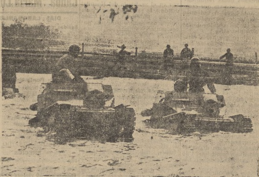
Después del restablecimiento del servicio militar obligatorio, el Ejército austriaco procede a un rearme intensivo y efectúa frecuentes maniobras. Dos tanques ligeros, durante unos ejercicios, atraviesan un río.

Laboratorio de análisis clínicos Farmacia SÓUSA Concepción, 6 Tel. 1918 HUELVA