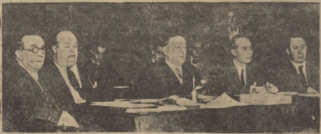
La presidencia del Congreso Nacional de Unión Republicana

Respecto a la huelga de la construcción, esta tarde, a las cuatro, celebrarán los patronos una asamblea general para la aprobación del reglamento que