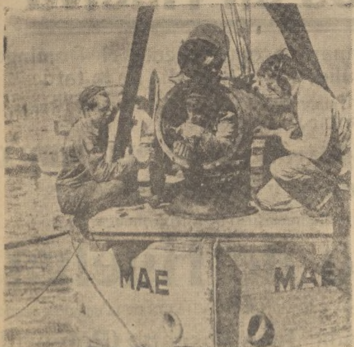
Aparato submarino con el que se están realizando, en la bahía de San Francisco (California), los trabajos para extraer los lingotes de oro que, por valor de 108.000 dólares, llevaba al zozobrar en 1913 el vapor «H. J. Cochán»