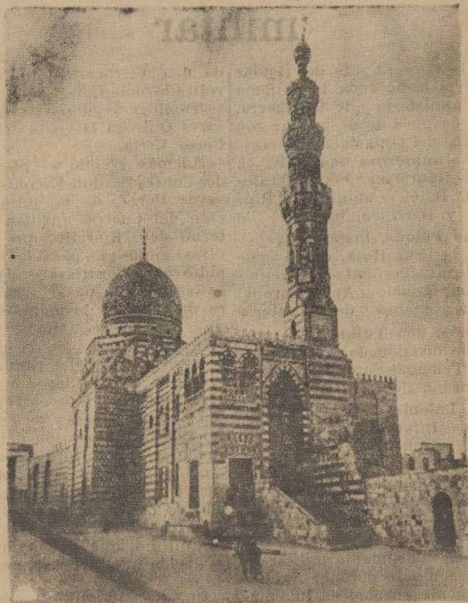
Mezquita de Kait-Bey