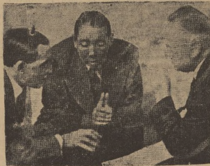
GINEBRA.—Politis, delegado de Grecia; Titulesco, de Rumania, y Litvinoff, de los soviets, en un misterioso aparte durante la sesión de la Sociedad de Naciones en que se trató del pleito italoetiope.

ESTE NUMERO HA SIDO VISADO POR LA CENSURA