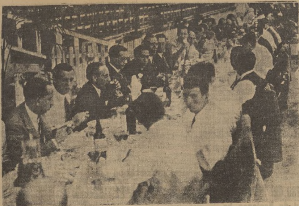
Los aficionados madrileños se reunieron el pasado lunes en un simpático banquete, organizado para testimoniar la alegría producida por el reciente triunfo logrado por el Madrid Football Club al lograr el campeonato con el rotundo triunfo obtenido en el campo de Mestalla, de Valencia.