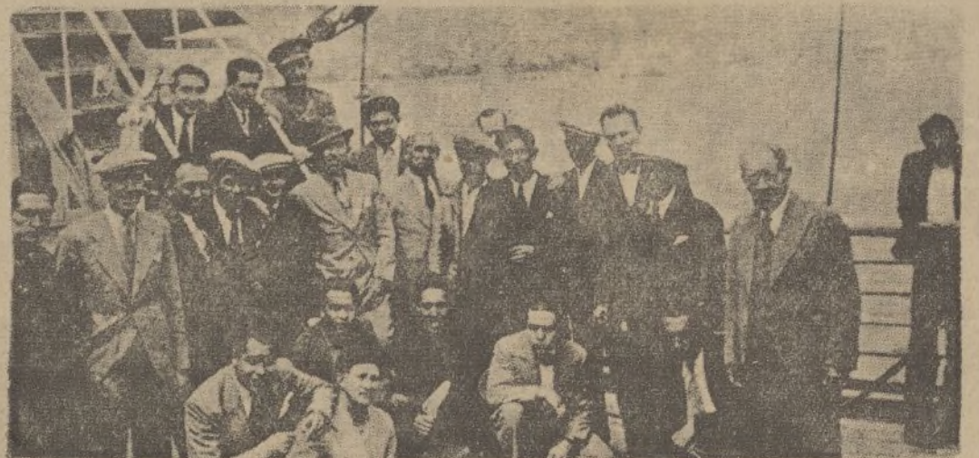
Grupo de diestros mejicanos que regresa a su país, debido al conflicto surgido con los toreros españoles

X X X X X X X X X X X X X X LEA VD. X X TODAS LAS MAÑANAS X X DIARIO DE HUELVA X X X X X X X X X X X X X