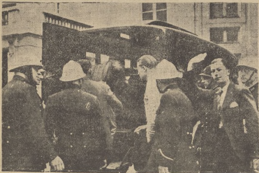
EL «REXISMO BELGA».—Durante la apertura del Parlamento de Bruselas se produjeron algunos incidentes, que motivaron varias detenciones de afiliados al novísimo partido «rexista».