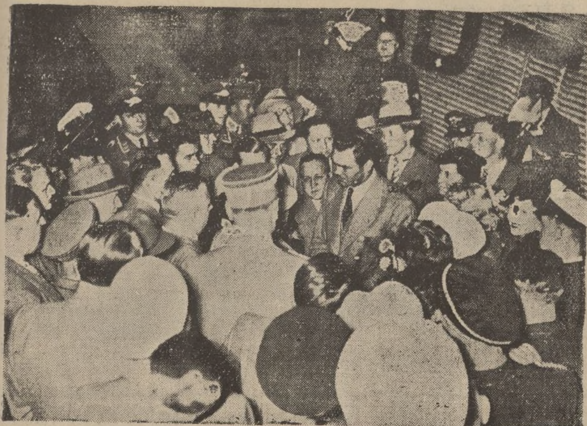
Max Schmelling llega a Berlín después de su resonante victoria sobre Joe Louis. El púgil alemán es objeto de un caluroso recibimiento, y al descender del avión, los ayudantes de Hitler le dan la bienvenida.