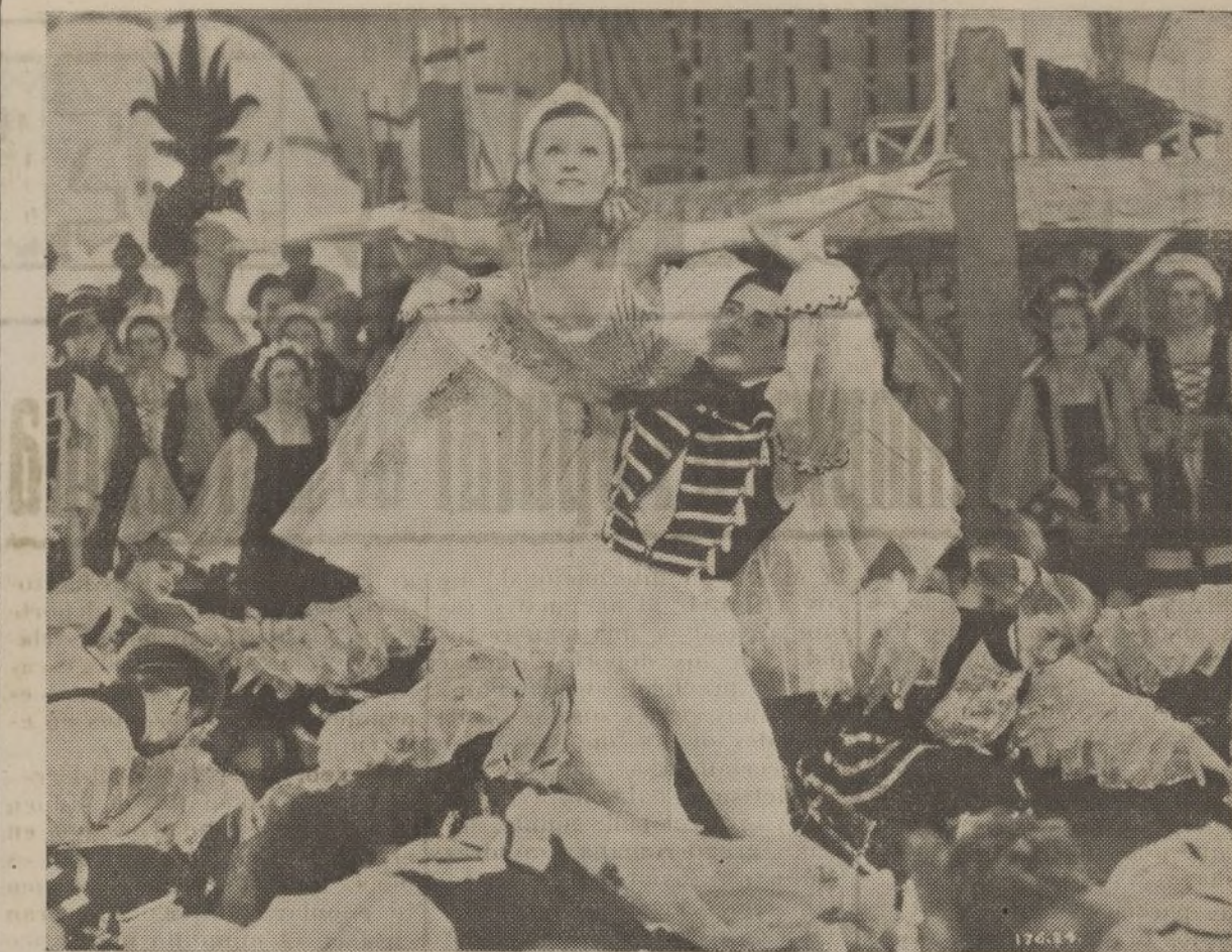
Uno de los aspectos de la magnífica producción B. I. P. protagonizada por la bellísima Lilian Harvey, «La bailarina del conjunto», que presenta Cifesa.

primer pan cocido por ellos, es de una emotividad sencillamente sublime.