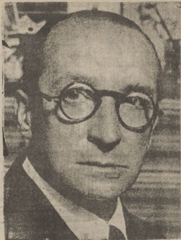
Don Aurelio Arteta, laureado pintor, que ha obtenido el premio nacional de pintura de este año