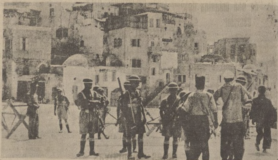
Las fuerzas británicas prosiguen la lucha contra los árabes rebeldes de Palestina. He aquí una patrulla cacheando a los transeúntes en Haifa