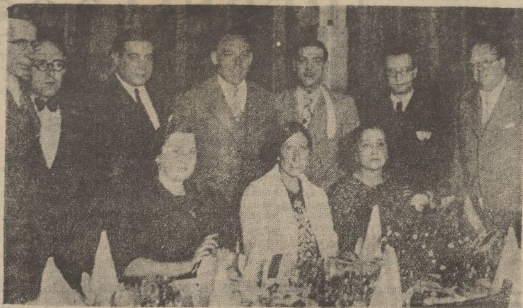
Los delegados del Comité de relación entre Toledo (Ohio) y Toledo (España) se han reunido en un banquete para tratar de las fiestas conmemorativas de la fundación de la ciudad norteamericana, con motivo de cumplirse el centenario