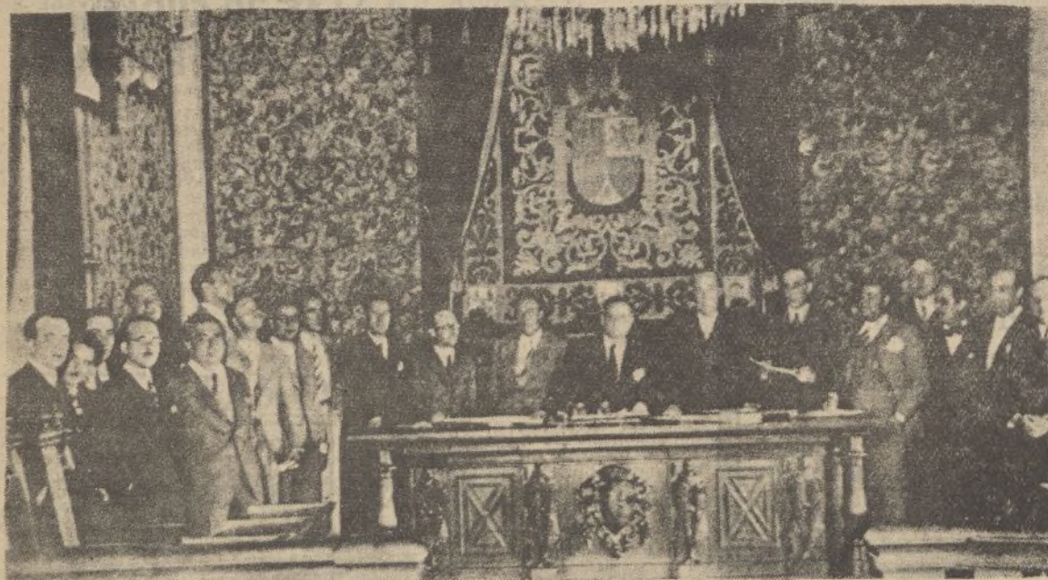
Los arquitectos de colegio de León han celebrado una reunión en la Diputación provincial de Salamanca, en donde ha tenido lugar la Asamblea del Consejo Superior de los Colegios

X X X X X X X X X X X X X X X LEA VD. X TODAS LAS MAÑANAS X DIARIO DE HUELVA X X X X X X X X X X X X X X