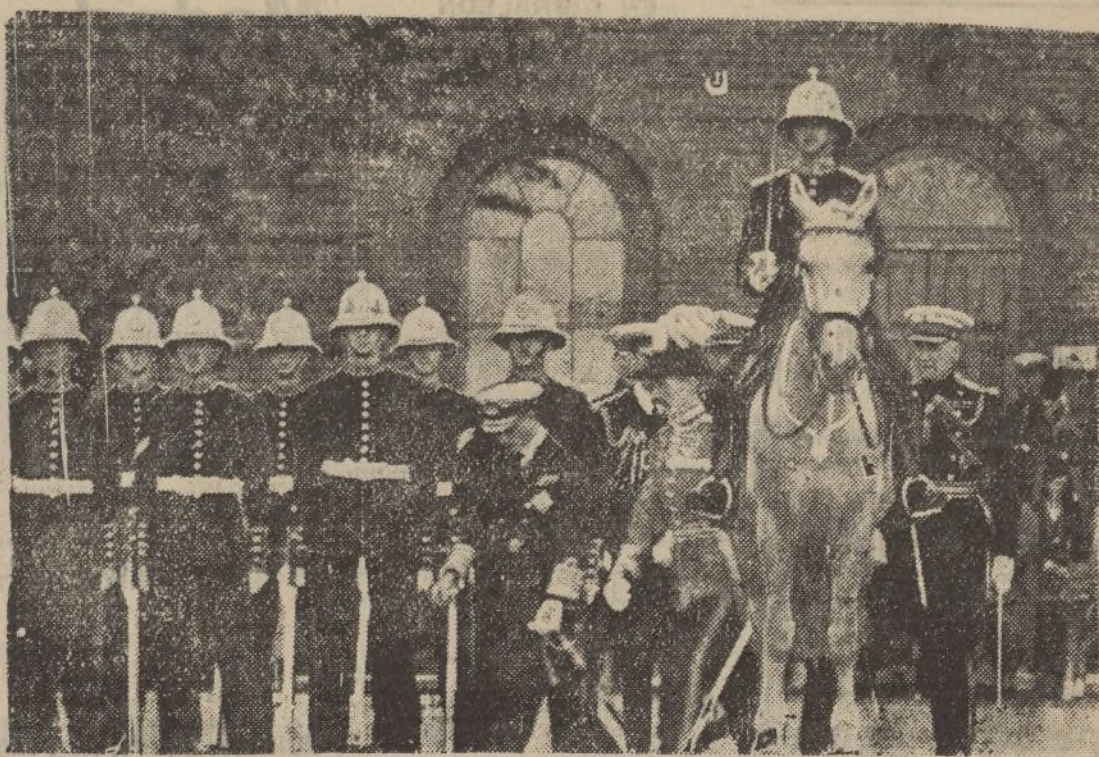
El soberano de Inglaterra, Eduardo VIII, ha hecho una visita de inspección a las fuerzas navales en Portsmouth. He aquí al nuevo monarca británico durante la revista que pasó a la Infantería de Marina de la división de Portsmouth, en el cuartel de Eastney.