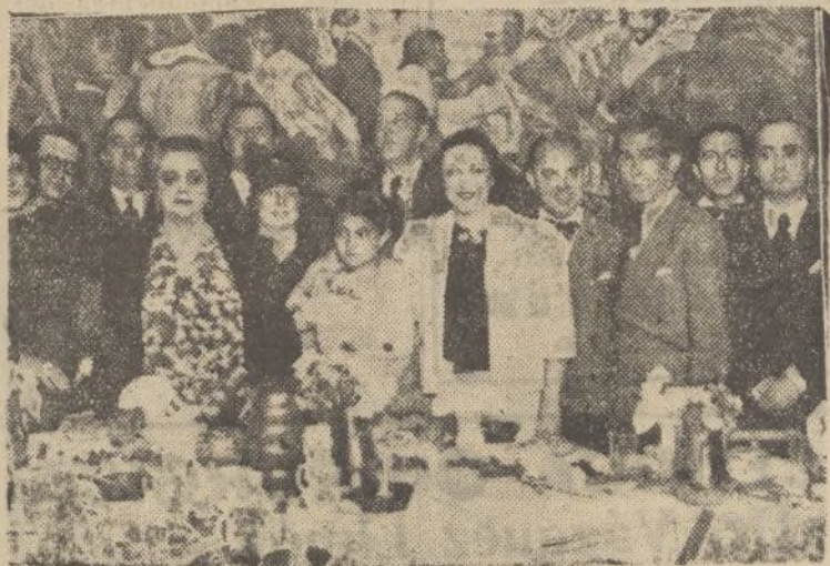
Los críticos teatrales de los diarios madrileños han rendido un homenaje a María Fernanda Ladrón de Guevara, por su artística brillante actuación durante la actual temporada.

Todos los días de la Novena, a las ocho de la mañana, habrá misa rezada, en el altar de la Santísima Virgen, aplicada por las hermanas difuntas.