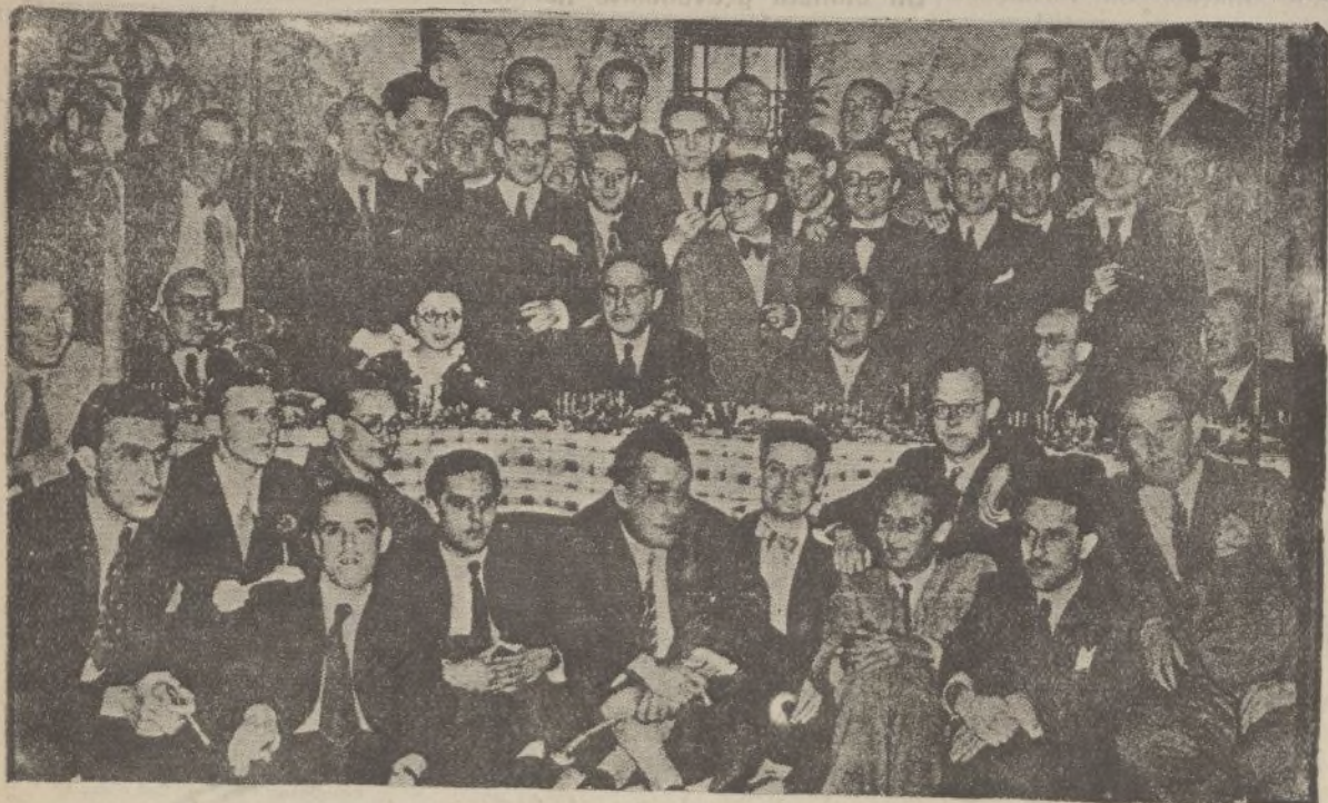
El ilustre doctor Marañón ha sido obsequiado con una comida al finalizar el curso 1935-36 por sus alumnos y colaboradores en el Instituto de Patología. En la foto, el eminente doctor con sus alumnos al terminar el acto