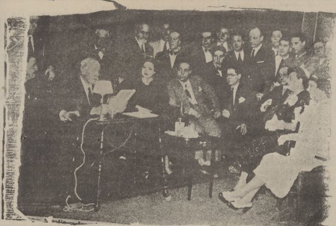
Los hermanos Serafin y Joaquín Alvarez Quintero acaban de leer a la Compañía de Carmen Diaz su última obra, titulada «La venta de los gatos»