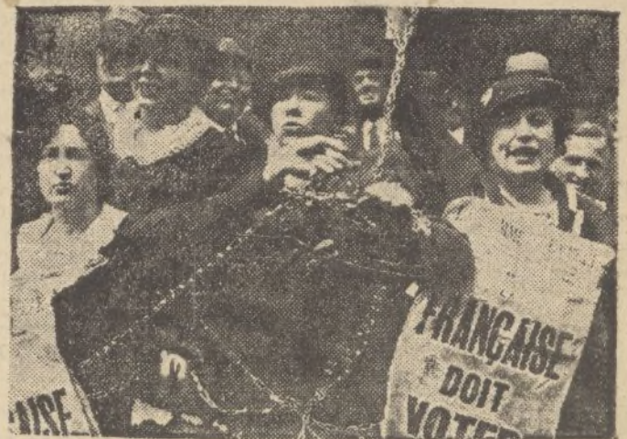
Los parisienses no pueden ocultar su alborozo ante ciertas manifestaciones feministas, que para exigir derecho al voto no reparan en los medios. Y hasta detienen la circulación con una cadena.