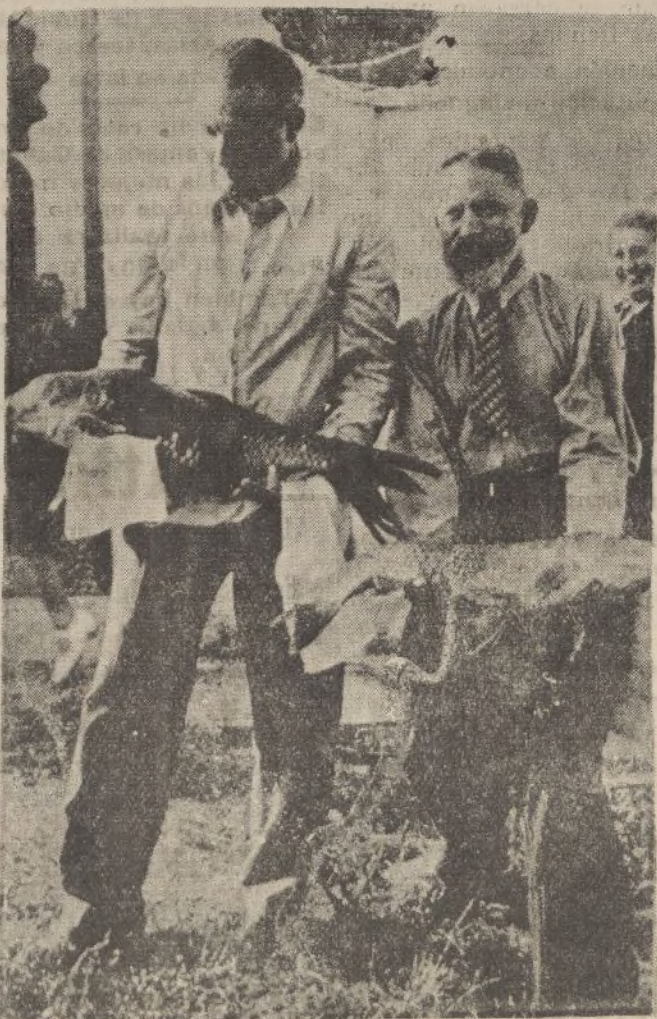
Dos aficionados a la pesca, mostrando dos magníficos ejemplares de carpas, de diez y doce kilos, pescados por ellos en el lago de Bañolas