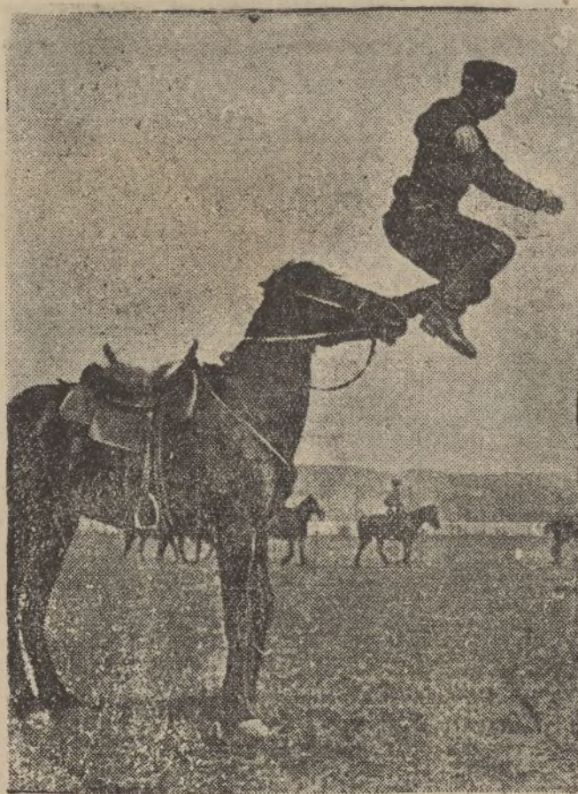
Los jinetes del Cáucaso del Norte son famosos por sus habilidades. Realizan las más curiosas acrobacias a caballo. He aquí un campesino «diguire», de la región de Karatchaf, en el Hipódromo de Piatigorsk, que da un salto de la silla al suelo, pasando por encima de la cabeza del caballo

TRANSPORTE GRATIS sobre muelles de este puerto o domicilio del comprador, dentro del radio de esta capital.