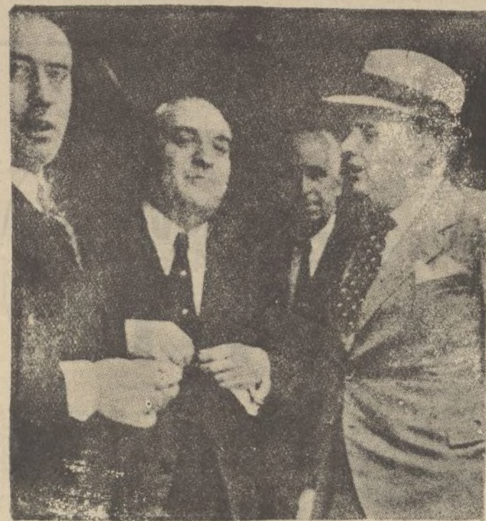
El ministro de Agricultura, señor Ruiz Funes, a su llegada al teatro Calderón, de Valladolid, donde dió una interesante conferencia.

Papelería del DIARIO DE HUELVA Alcalá Zamora, 15