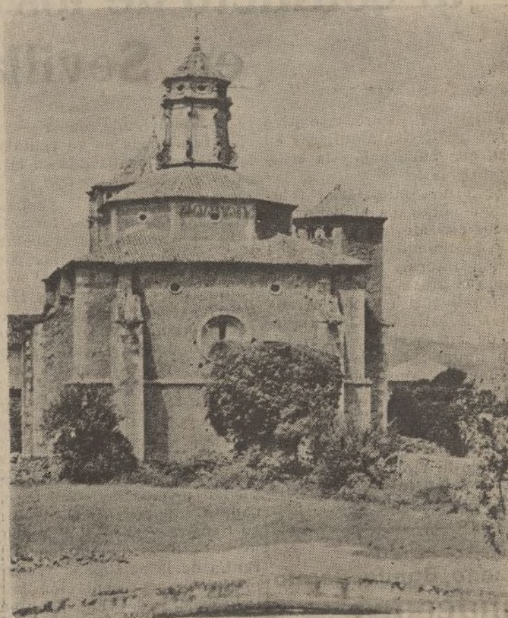
El ábside, del Monasterio del Poblet

ESTE NUMERO HA SIDO VISADO POR LA CENSURA