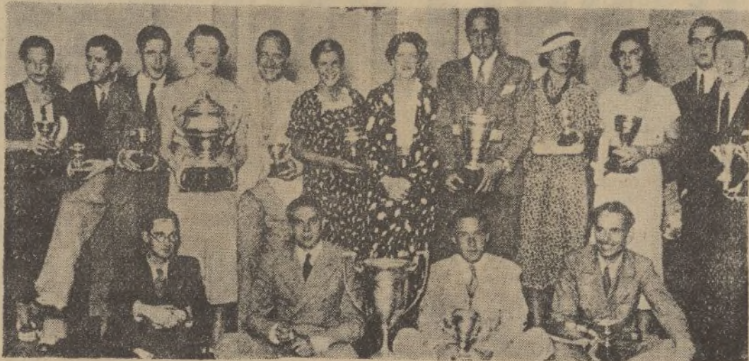
Participantes en el torneo de tenis del Club de Campo, celebrado en Puerta de Hierro, con los premios conquistados