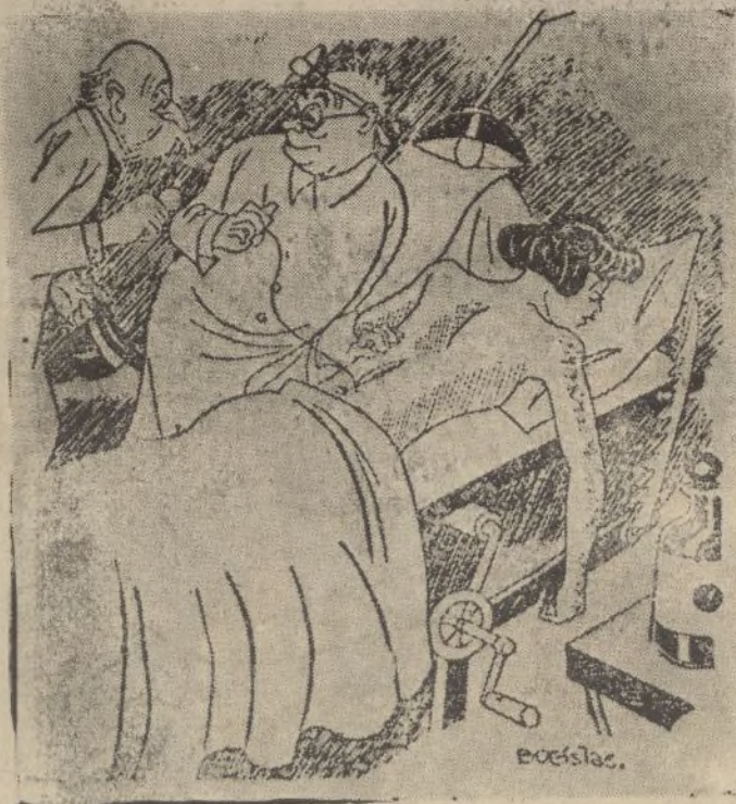
EL MARIDO.—Doctor: le doy cincuenta francos más si le cose también la boca.