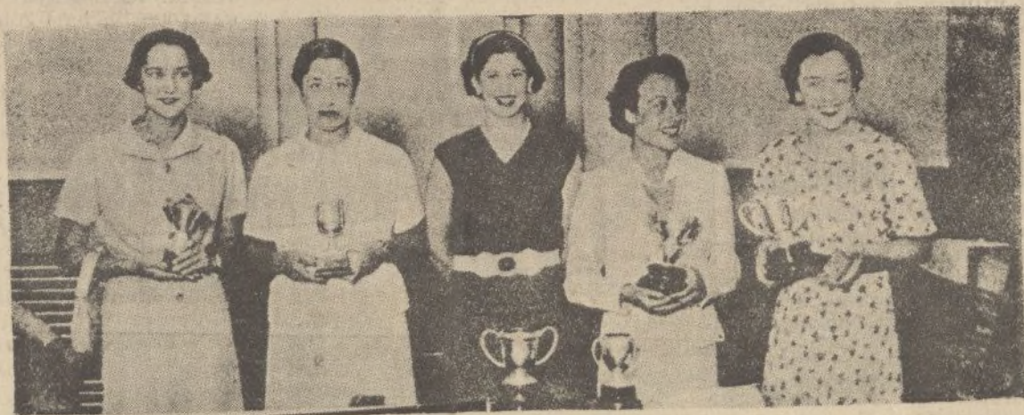
Grupo de bellas señoritas que obtuvieron premios en una fiesta automovilista celebrada en Puerta de Hierro