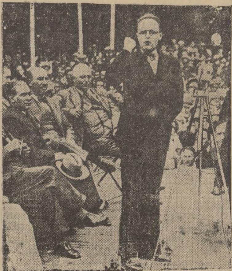
El ministro del Aire francés, M. Pierre Cot, saluda a los enviados especiales de diferentes países pro-olimpiadas populares, reunidos en París en asamblea