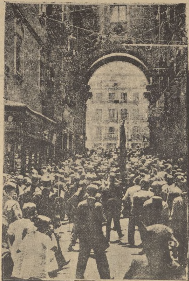
Los milicianos pasando bajo el Arco del 7 de Julio en su desfile anual por las calles de Madrid.

SE TRASPASA por ausencia el acreditado establecimiento de bebidas «La Madrileña», calle Corvantes. Razón en el mismo local.