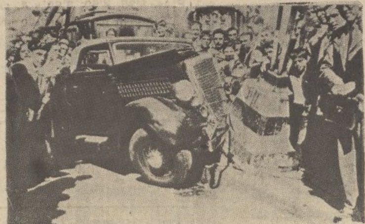
Estado en que quedó el automóvil que chocó contra un poste de señales de circulación en la madrileña calle de Alcalá, frente al edificio del Banco de Vizcaya. Los cuatro ocupantes del coche resultaron heridos

Creo el señor Moreno Torres que la discusión para emitir dictamen habrá de ser muy laboriosa por la entraña del problema y lo que alcanza con su significación.