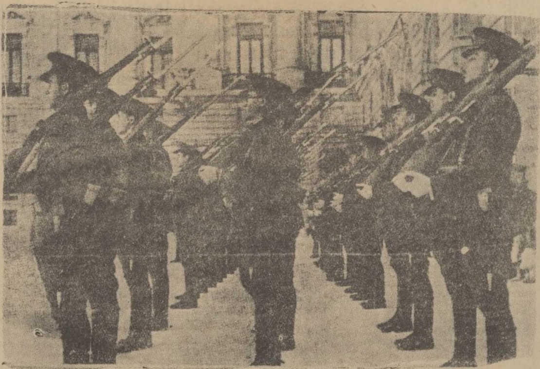
Los cadetes hacen guardia en el Palacio Nacional de Madrid. Una multitud abigarrada de ancianos, niños y mujeres contempla a diario la ceremonia de la entrada y salida de guardia y la parada habitual, amenizada por la banda. La marcialidad de los cadetes provoca la justa admiración del público.