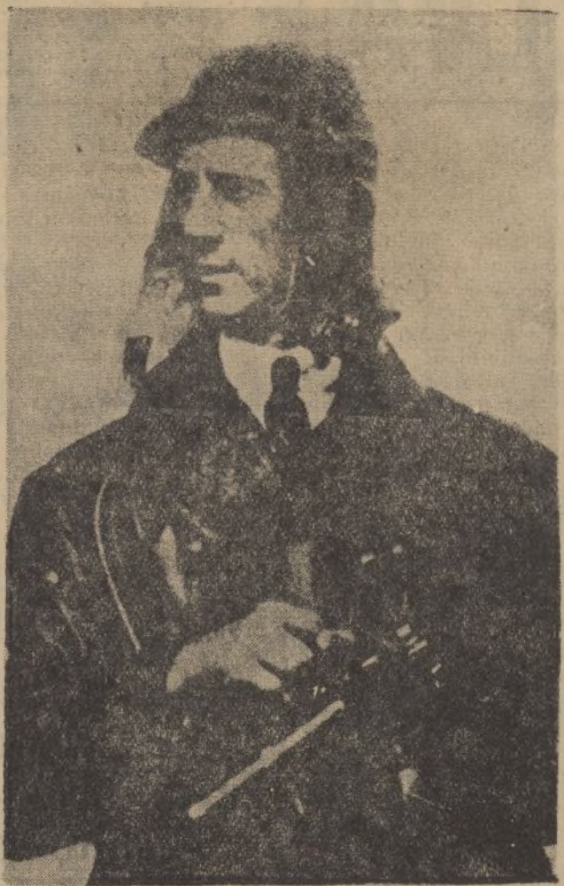
El aviador italiano Locatelli, al que una patrulla de etiopes dió muerte en Gore (parte occidental de Abisinia)