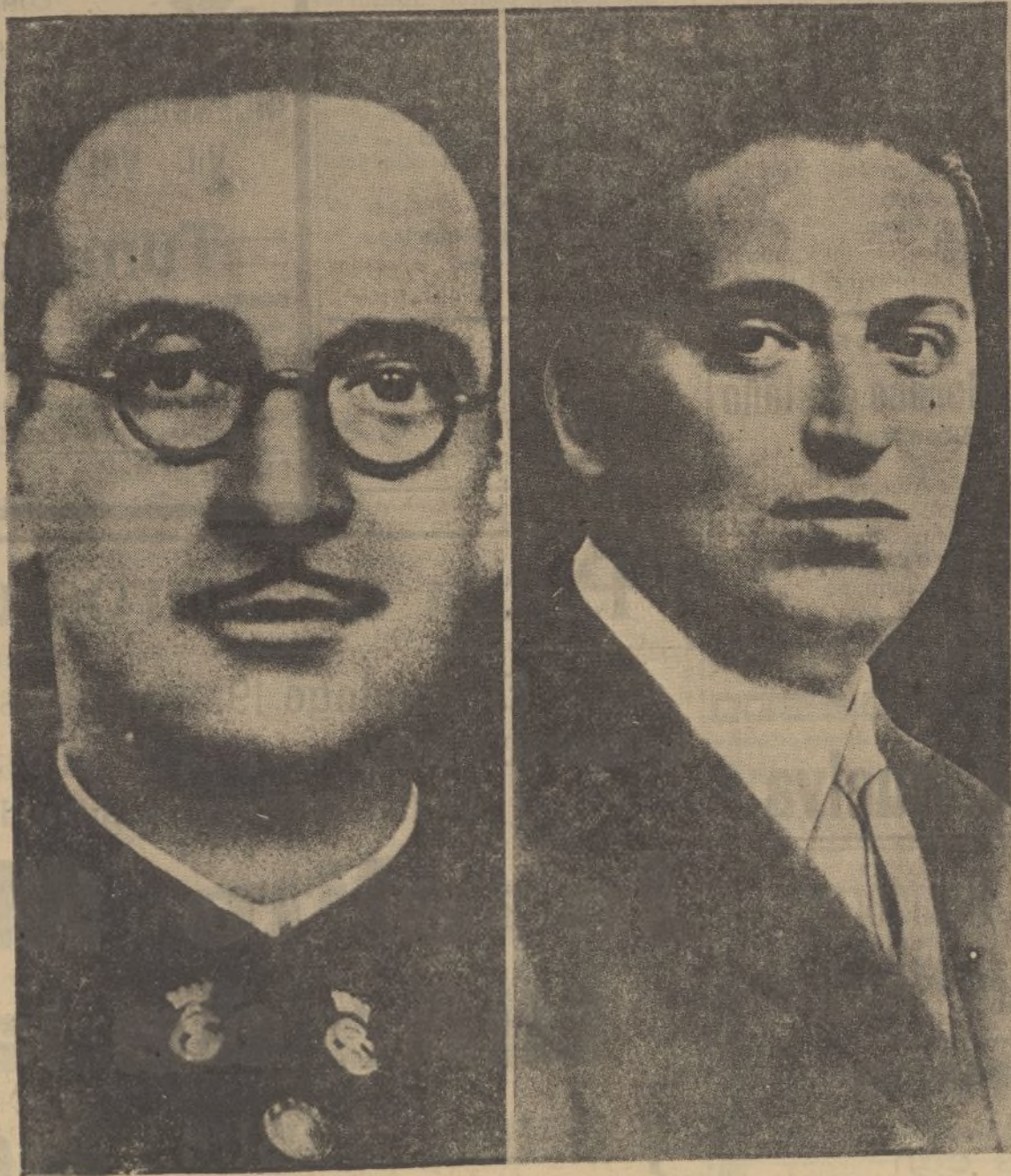
El teniente de Asalto don José Castillo, y el diputado a Cortes don José Calvo Sotelo, que han sido víctimas de los instintos criminales desatados por la pasión política.

Con motivo de estos hallazgos, se han practicado numerosas detenciones, tanto en Madrid como en provincias, las cuales al parecer, ascienden a unas ciento cincuenta personas.