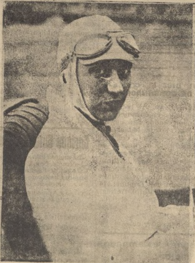
La corredora francesa Helene Nice, que en una carrera de automóviles en San Pablo, se despidió y se lanzó contra el público, resultando muertos dos espectadores y treinta heridos.

Sagasta, 3 y 5 - HUELVA - Teléfono, 1512