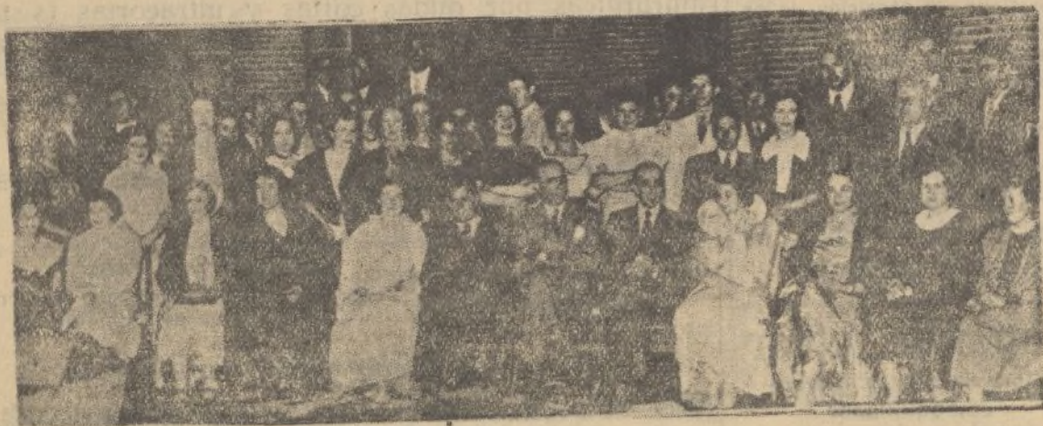
Un momento del acto inaugural del Curso de Verano para extranjeros, que organiza anualmente el Centro de Estudios Históricos en la Residencia de Estudiantes

ESTE NUMERO HA SIDO VISADO POR LA CENSURA