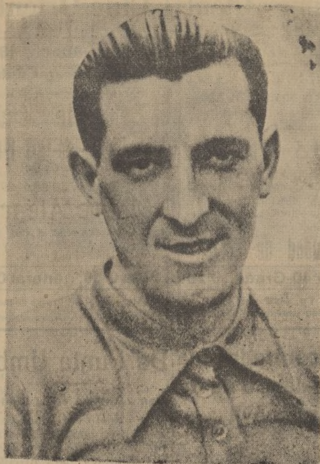
Federico Ezquerro, el gran corredor español, que con Cañardé y Berrendero está llevando a cabo una brillantísima carrera en la Vuelta Ciclista a Francia.

Dentro del coche la Policía pudo encontrar, debajo del baquet, cajas de cápsulas de pistola ametralladora.