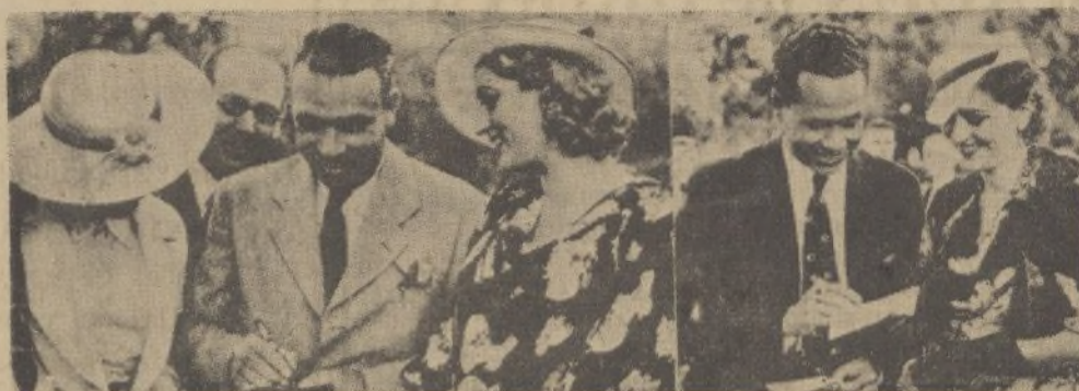
Las lindas concurrentes a la fiesta dedicada a los aviadores Calvo y Arnáiz en el reservado de la Casa de Campo obtuvieron de los pilotos numerosas dedicaciones de su estancia en Madrid. He aquí a Calvo y Arnáiz suscribiendo autógrafos

donde encontrará un extenso y variado surtido en plumas estilográficas y artículos de escritorio