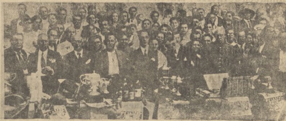
El gobernador civil de Madrid y el alcalde de Manzanares el Real y otros invitados en el reparto de premios del concurso nacional de pesca celebrado en la presa de Santillana