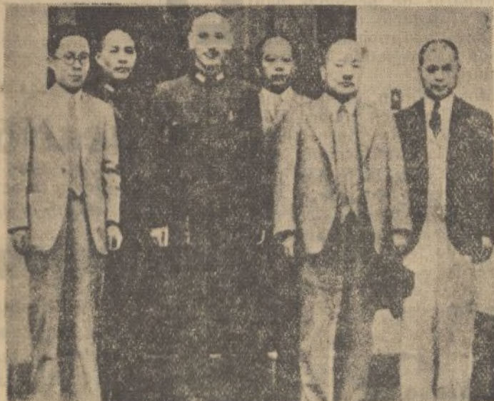
El general Chan-Kai-Shek (en el centro), jefe del Gobierno del Kuomintang, después de la entrevista celebrada con el general japonés Kito, nuevo agregado militar de la Embajada nipona en China.

En cajitas de 28-30 grageas. Ptas. 1,90 (timbre incluido), en Farmacias.