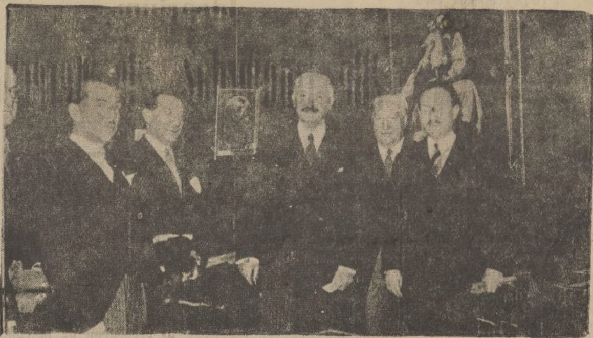
Monsieur Lebrun, en el acto inaugural de la Exposición del Libro Antiguo Español. Con el presidente de la República francesa aparecen el ministro de Estado, M. Chautemps, y el embajador de España, señor Cárdenas