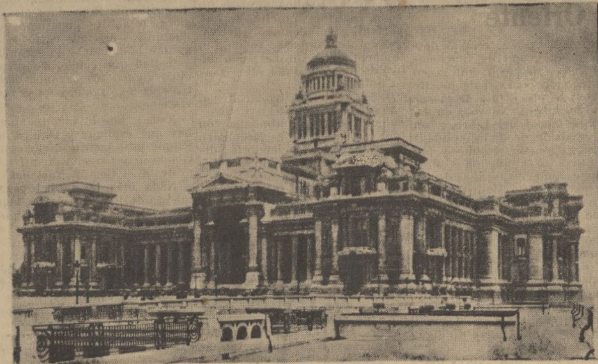
BRUSELAS.-El palacio de Justicia

do con lucidez y dominio, a más del «abstractum» de vida y ambiente, cuantas sugerencias pueden despertarse en torno a la cultura y la vida de la época. La simple ojeada del volumen, tan extenso, denota lo ciclópico de su planeamiento y desarrollo, le minucioso de su acervo documental—en el que es de señalar la parte iconográfica, sobre manera interesante, que aparece reproducida en una sesentena de láminas—y su disertación con pulso esclarecedor en un verdadero océano de figuras y hechos, así como visiones encontradas y críticas contradictorias precedentes. Si de algún otro libro del autor hubo quien dijo no ser posible resumirle en un artículo, con mayor motivo cabe afirmar de este que