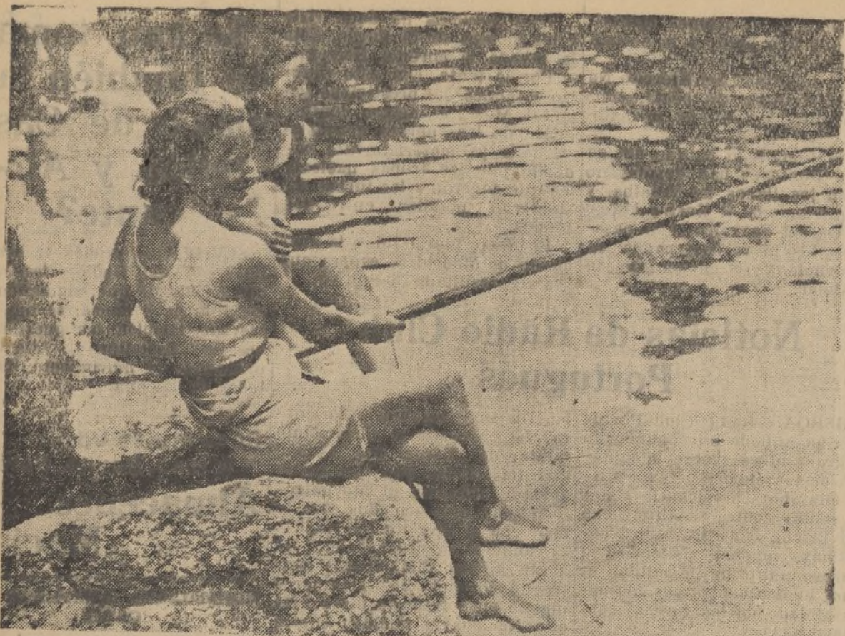
Unas bañistas de Balsain, que en la estación estival prestan a aquellas playas la nota de mayor atracción.