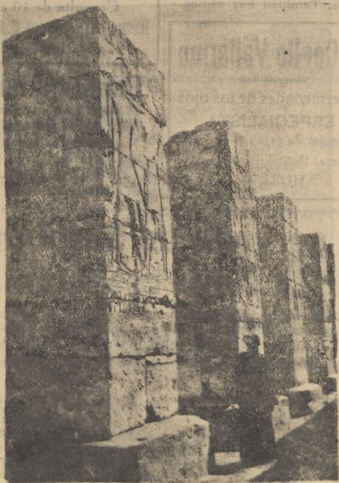
Abydos, la ciudad Santa de Osiris. Columnata cuadrada del primer patio

buques pasearon por las calles de la ciudad entre constantes ovaciones del público, a cuyas demostraciones de afecto correspondían los marinos con el saludo militar.