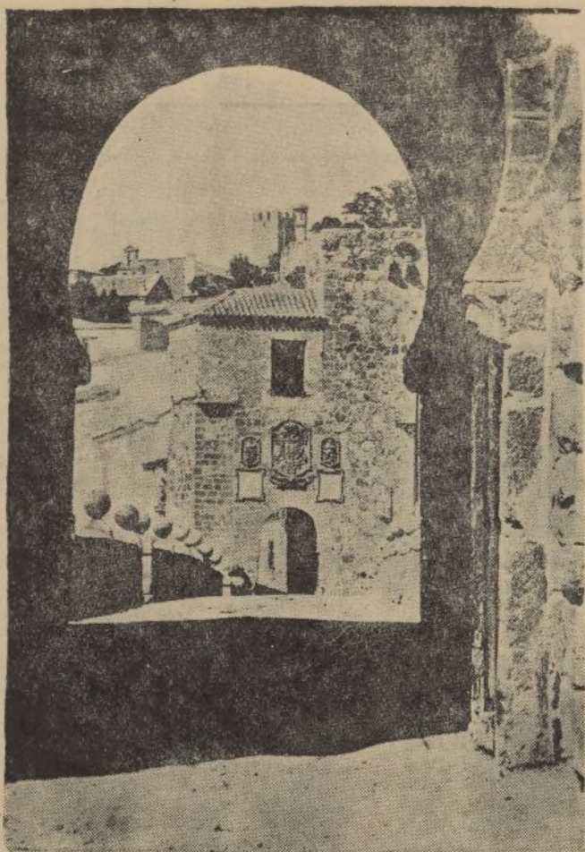
TOLEDO.—Puente de San Martín.