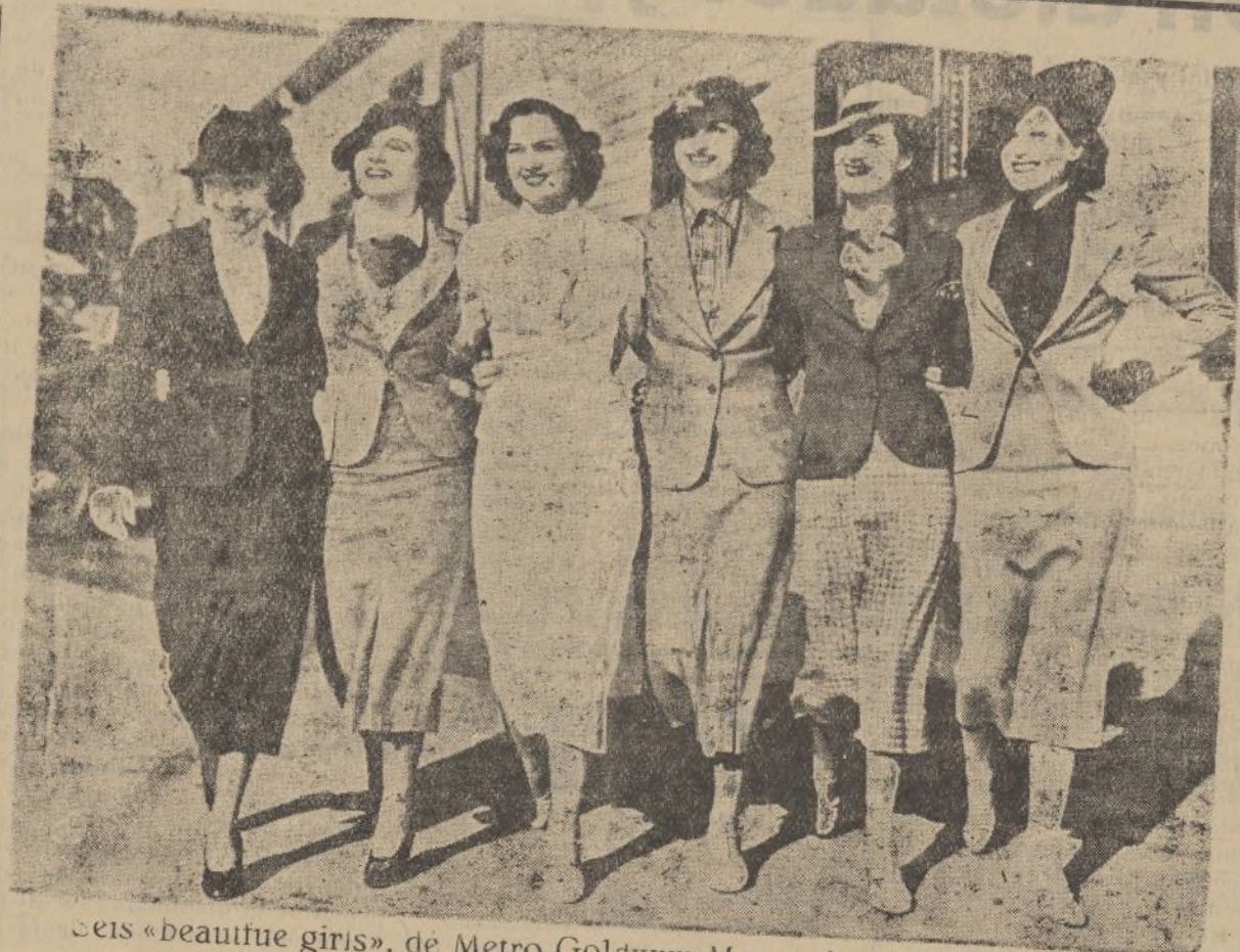
Seis «beautifue girls», de Metro Goldwyn Mayer, luciendo otros tantos modelos de vestido hechura sastre.

XXXXXXXXXXXXXXXXXXXX X X LEA VD. X X TODAS LAS MAÑANAS X X DIARIO DE HUELVA X XXXXXXXXXXXXXXXXXXXX