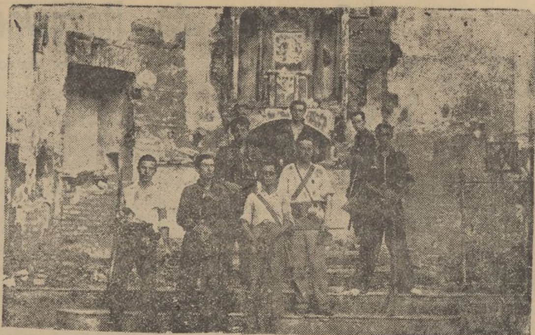
Grupo de voluntarios que salvaron a Niebla, posan en lo que ha quedado de la iglesia quemada por los marxistas.