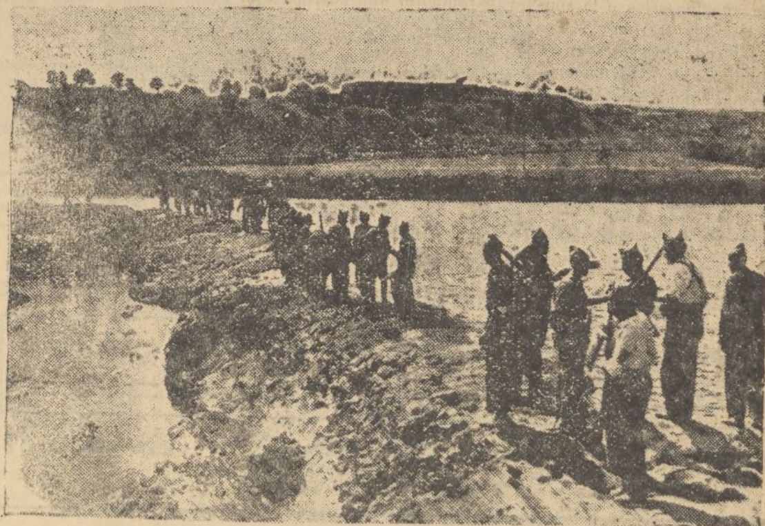
Las fuerzas pasan el puente de Niebla, a pesar de aparecer destruido por la acción destructora de la dinamita.

j) Debe activarse la instrucción de movimiento de las milicias, así como las armas y tiro, para la buena disciplina y la eficacia en el manejo de las armas, acostumbrado a cumplir sin vacilación la misión que a cada uno se confiera y haciéndoles ver el peligro que para ellos les puede acarrear la traición. Diariamente aprovechando la soledad de la noche se harán explicaciones de la táctica de la calle para que se acostumbren a esta actuación. Las milicias encargadas de defender las poblaciones, se situarán en las inmediaciones de los lugares de salida para evitar que derrotado el Ejército, pueda replegarse al exterior. Se situarán los nidos metálicos de ametralladoras mirando a las poblaciones y, al intentar salir las fuerzas se abrirá fuego con toda intensidad, apoyado con fuego de fusilería, y si a pesar de ello intentasen avanzar, se hará uso de bombas de mano ofensivas.