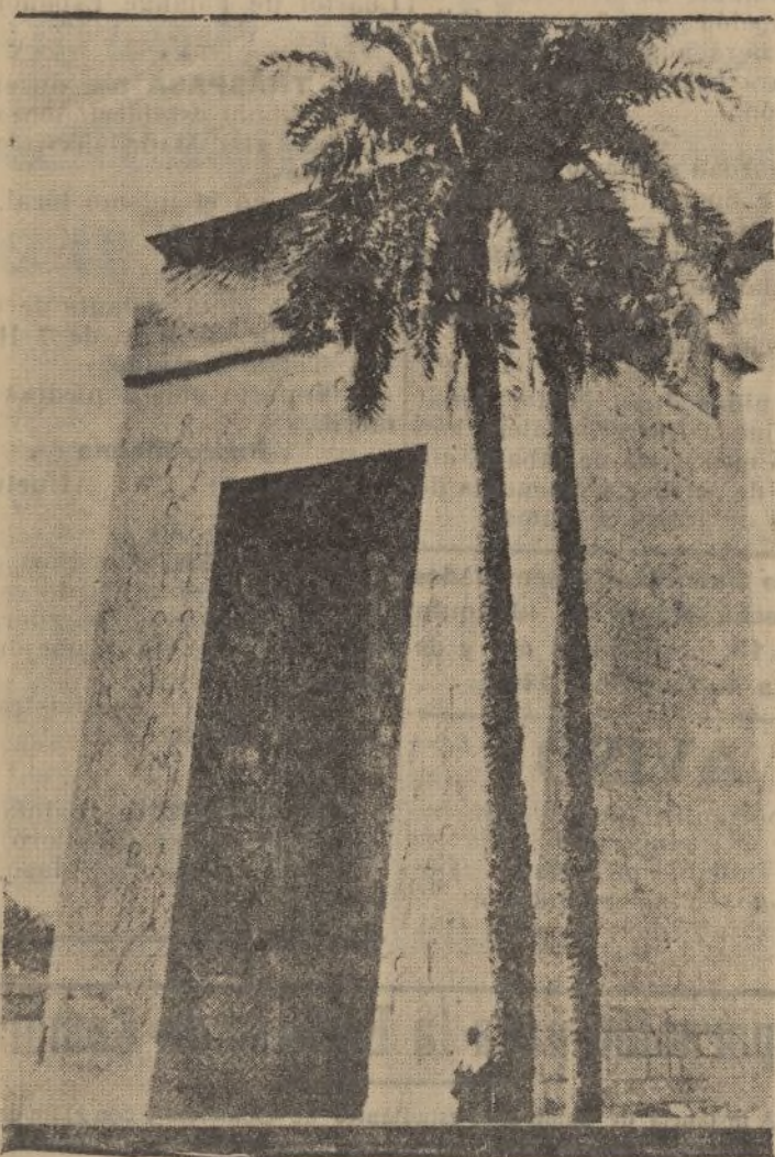
Puerta Ptolemaica denominada «El Arca»