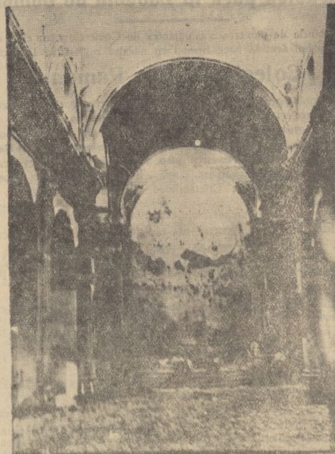
Estado de ruina en que quedó, después del ataque marxista, el hermoso templo parroquial de La Palma