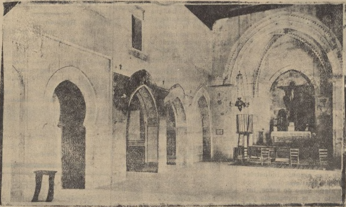
La hermosa capilla del histórico Monasterio de la Rábida donde se han consumado dolorosos desmanes contra el espíritu glorioso de la historia de Huelva.