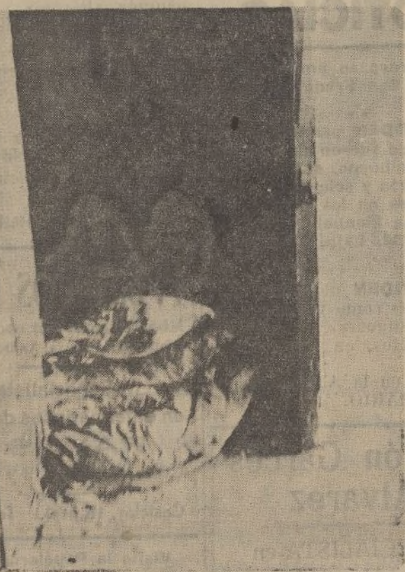
Ante la puerta de una de las celdas de la cárcel de La Palma, se amontonan esos colchones empapados de sangre de un puñado de víctimas inocentes

La Palma del Condado, aquel pueblecito blanco y riante, donde el sol no se cansaba de dejar caer sobre sus casas y calles todo el raudal de sus rayos cálidos y alegres, aparece hoy triste y sombrío porque la congoja de los espíritus se ha sobrepuesto y eclipsado a aquellos elementos de la Naturaleza, pródiga y exuberante.