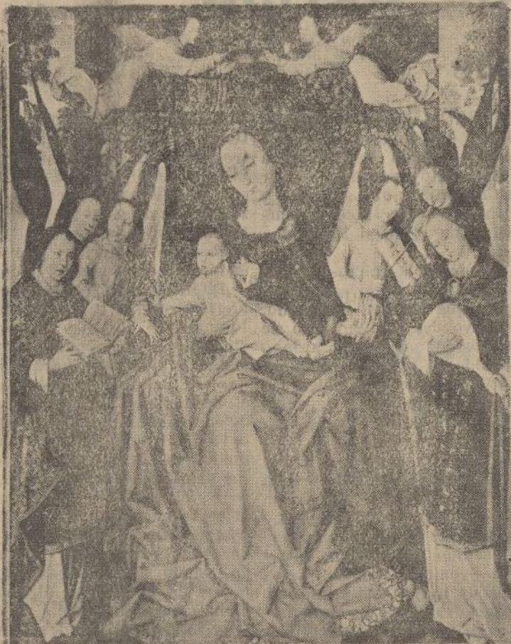
La Virgen rodeada de ángeles (siglo XVII)