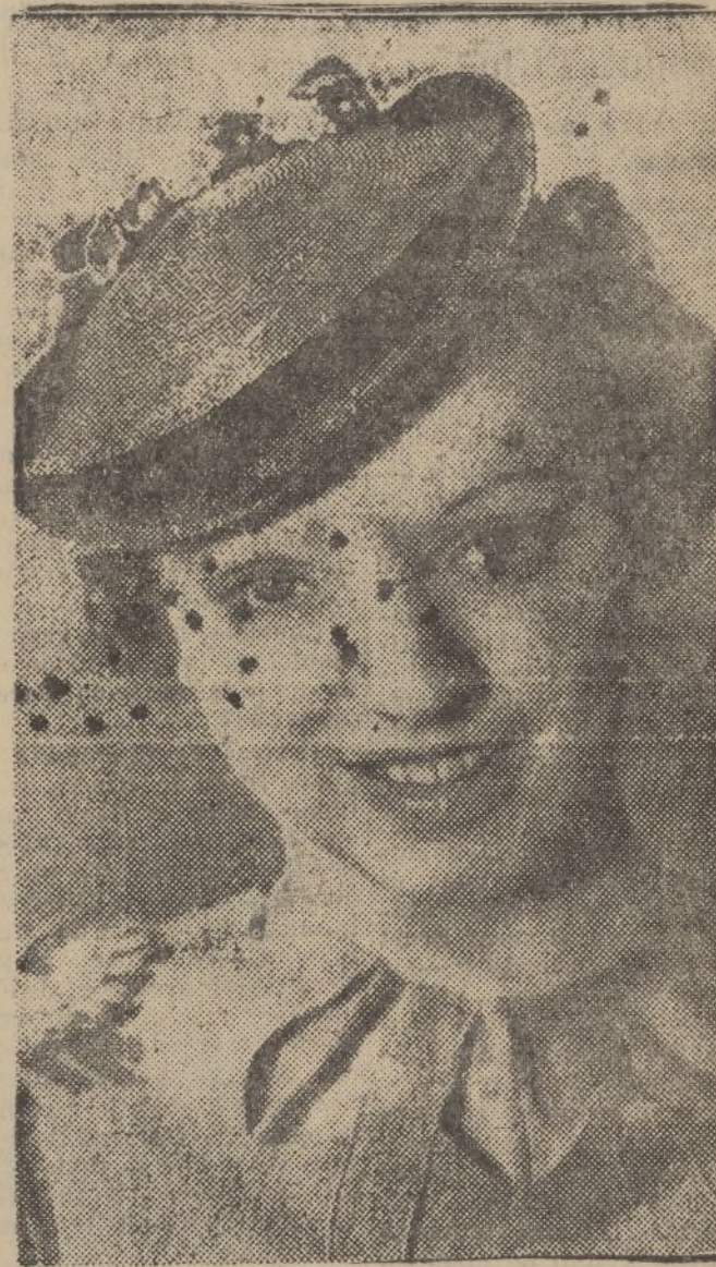
Elegante sombrero en paja marrón adornado con flores rojas.

X X X X X X X X X X X X X X X X X LEA VD. X X TODAS LAS MANANAS X X DIARIO DE HUELVA X X X X X X X X X X X X X X X X X