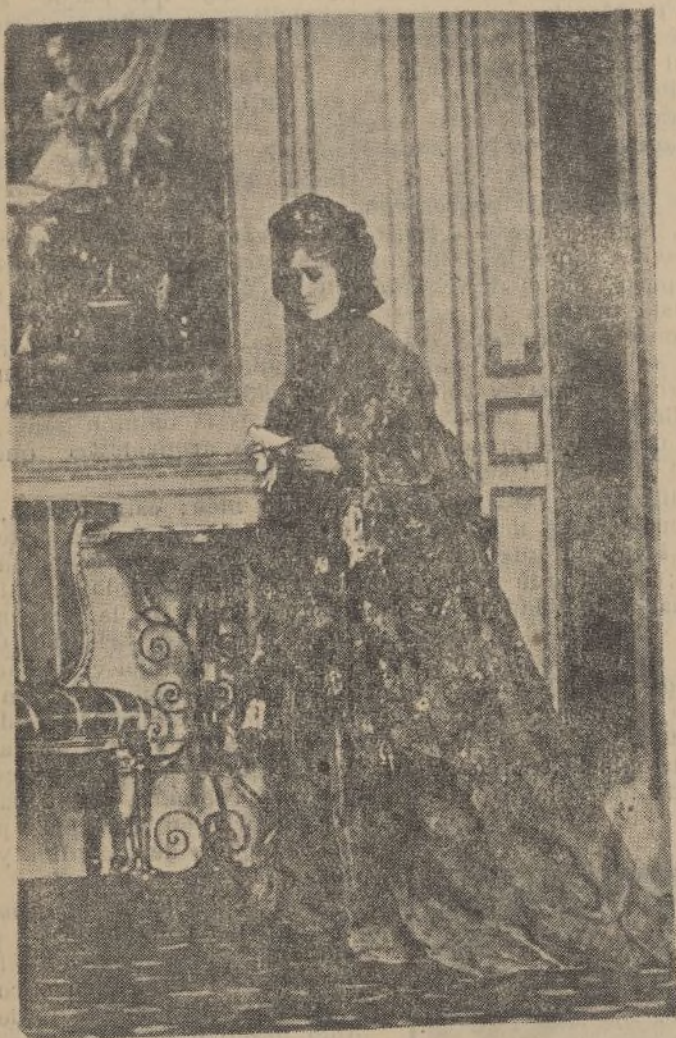
Alfred Stevens.-La dama del billete