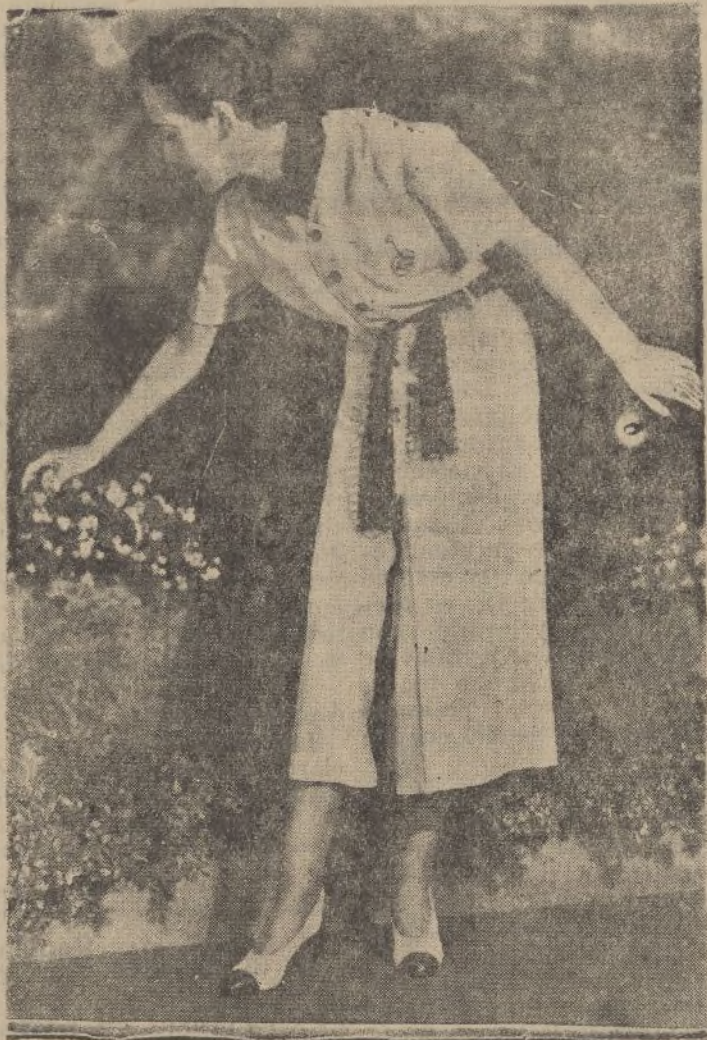
Modernísimo traje color barquillo para jardín. La bufanda, los botones, el bordado del bolsillo y el cinturón, en tono tostado.