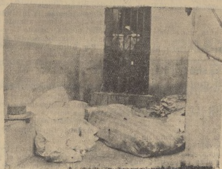
Otro aspecto de la cárcel de La Palma. Colchones ensangrentados, ropas revueltas sobre las que se agitaron en terrible agonía un puñado de mártires.

Cuarta.—La situación de las fuerzas nacionalistas es la del Ejército, que ocupa las dos terceras partes de su país; es absolutamente dueño de él, y se halla a las puertas de la capital que tiene cercada a mayor o menor distancia.