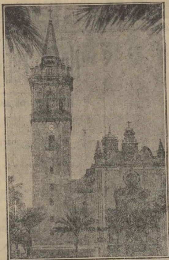
El magnífico templo parroquial de La Palma, de estilo plateresco, uno de los monumentos religiosos más notables de la provincia, que ha sido destruido en uno de los pasados días de subversión marxista.