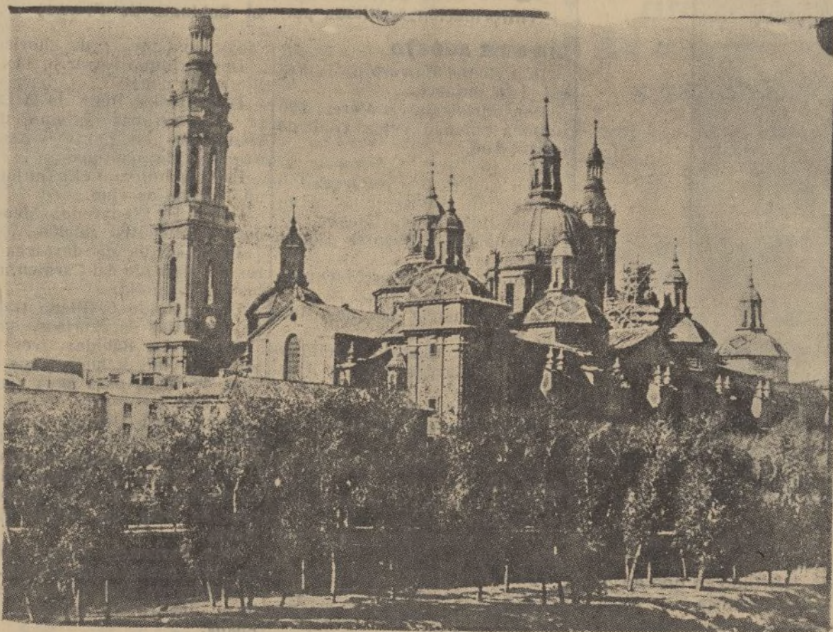
El magnífico templo del Pilar, edificado sobre el antiguo tiempo del rey Carlos II, que ha sido bárbaramente bombardeado por un sargento aviador al servicio de las fuerzas del Gobierno de Madrid