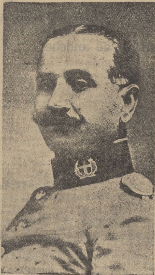
El general Queipo de Llano, jefe del movimiento salvador de España en Andalucía, y que desde el micrófono de Radio Sevilla informa a los buenos españoles de la marcha gloriosa del alzamiento nacional

donde encontrará un extenso y variado surtido en plumas estilográficas y artículos de escritorio