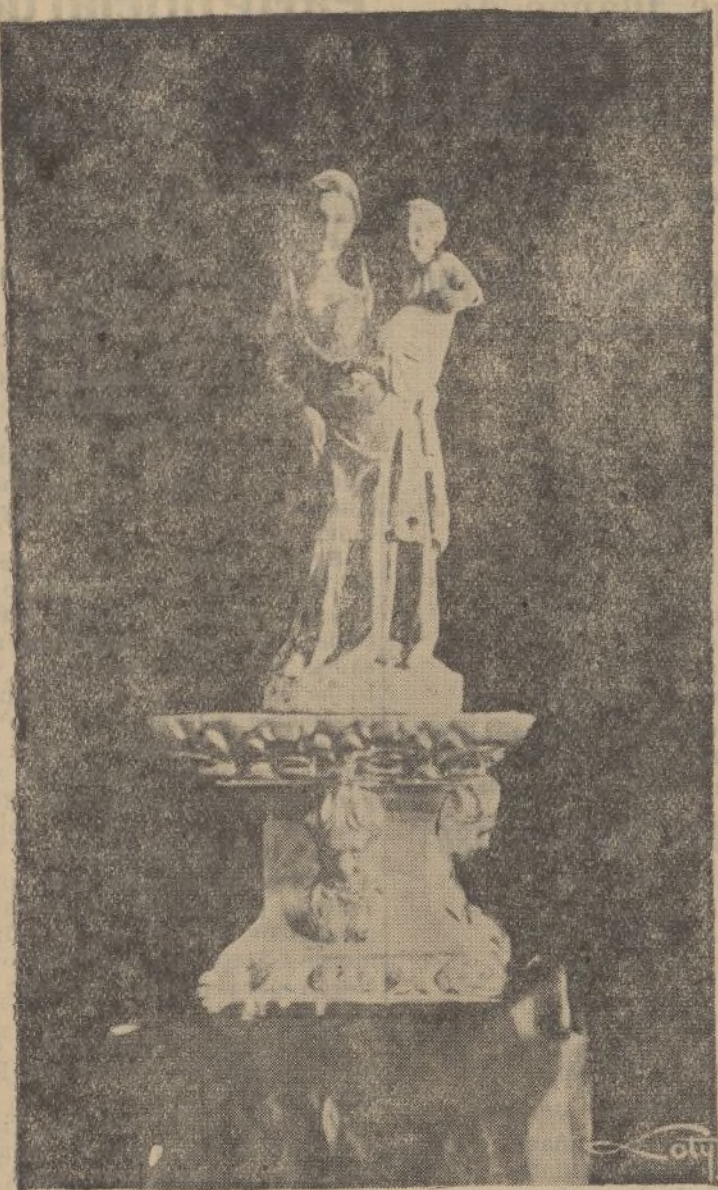
La valiosa imagen de alabastro de la Virgen de los Milagros, destrozada en la parroquia de Palos de la Frontera por las turbas enloquecidas.