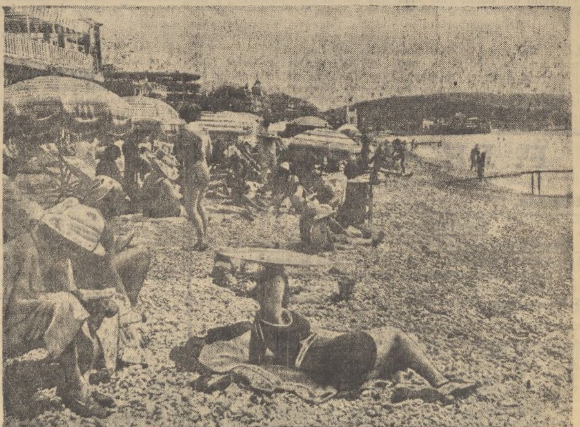
NIZA.—Los bañistas, bajo el sol, pasan las horas matinales, ajenos a las inquietudes que el resto de la humanidad tiene que soportar en estas horas de lucha y de agitación en el mundo