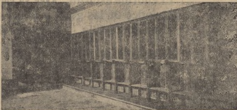
Riquísima sillería del coro en el convento de Santa Clara de Moguer, también destruida por la barbarie roja.