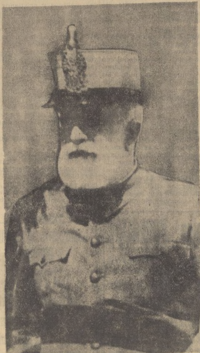
El general Cabanellas, Presidente de la Junta de Defensa Nacional, residente en Burgos, actual capitalidad de la España nueva.