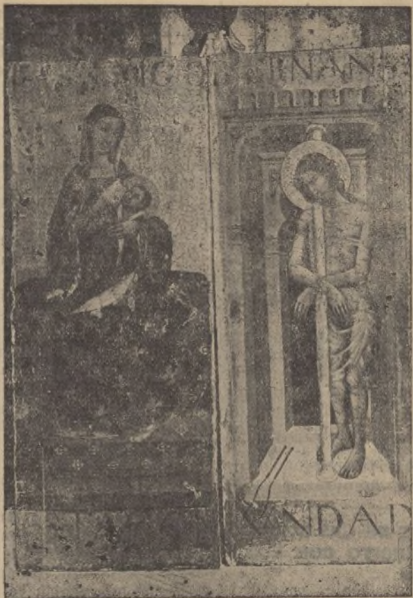
Valioso díptico de la escuela italiana que se guardaba en el convento de Santa Clara, de Moguer, hoy desaparecido en la destrucción llevada a cabo por unos bárbaros.