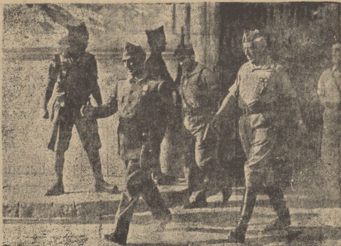
SEVILLA.—El general Franco y el teniente coronel Yagüe, se dirigen a la Comandancia General

Las fuerzas rojas cogieron presos a siete súbditos alemanes, pero un barco de guerra alemán los libertó, debido a que el comandante del barco intimó a los comunistas a que se los entregara o haría fuego sobre la plaza.