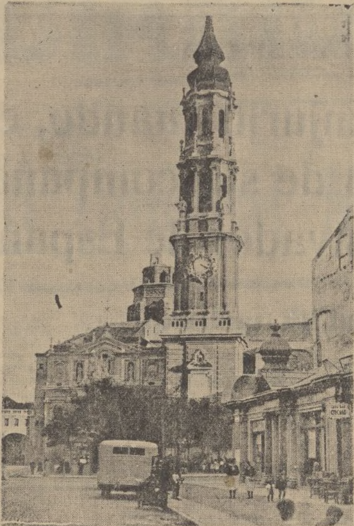
CATEDRAL Y TORRE DE LA SEO